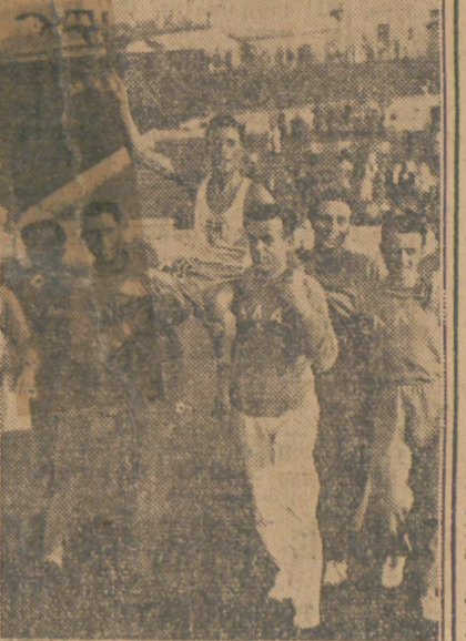
Kiriakides (Grecia), câștigătorul maratonului, este purtat pe umeri de compatrioți, după victorie.

MARATHONUL BALCANIC Clasică probă de fond, maratonul, la care s'a dat plecarea încă de la ora 14,30, a avut o desfășurare dramatică. După obișnuitul tur pe stadion, cei 18 concurenți, reprezentând pe fiecare din