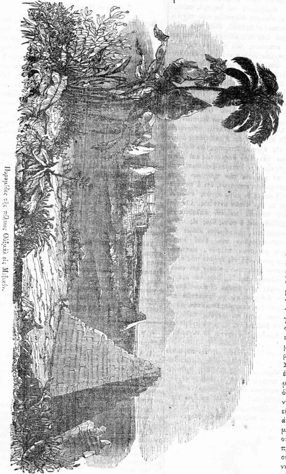
Πυραμίδες τῆς Πύλωνος Οὐζὴντὸν εἰς Μείδον.

Ἐδῶ ἀπογαίρετῷ τὰς πυραμίδας διὰ νὰ στραφῶ πρὸς δυσμᾶς, ὅπου μέλλω νὰ ἐπισκεφθῶ τὸν Λαθύρινον καὶ τὴν λίμνην τοῦ Μοίριος, καὶ ἐδῶ ἀναγκάζομαι προσωρινῶς ν' ἀποχαιρέτήσω καὶ σὲ. Ἀλλὰ, διὰ νὰ μὴ σ' ἀφήσω ὑπὸ τὴν ἐντύπωσιν τῆς τοσαύτης Αἰγυπτολογίας μου, σοὶ ἐπισυνάπτω εἰκόνα δεδαμισμένην ἐκ τῆς περιηγήσεως τοῦ Κ. Στέφενς εἰς τὰ ἐνδότερα τῆς Ἀμερικῆς, νομίζων ὅτι θέλει σοὶ φανῆ περιεργόν, ὅτι εἰς μέσην τόσον ἀπ' ἀλλήλων μακρυσμένα καὶ οὐδεμίαν ἔχοντα πρὸς ἀλλήλα σχέσιν, ἡ ἀνθρωπίνη φιλοκαλία τὰ αὐτὰ περιπνεύ-