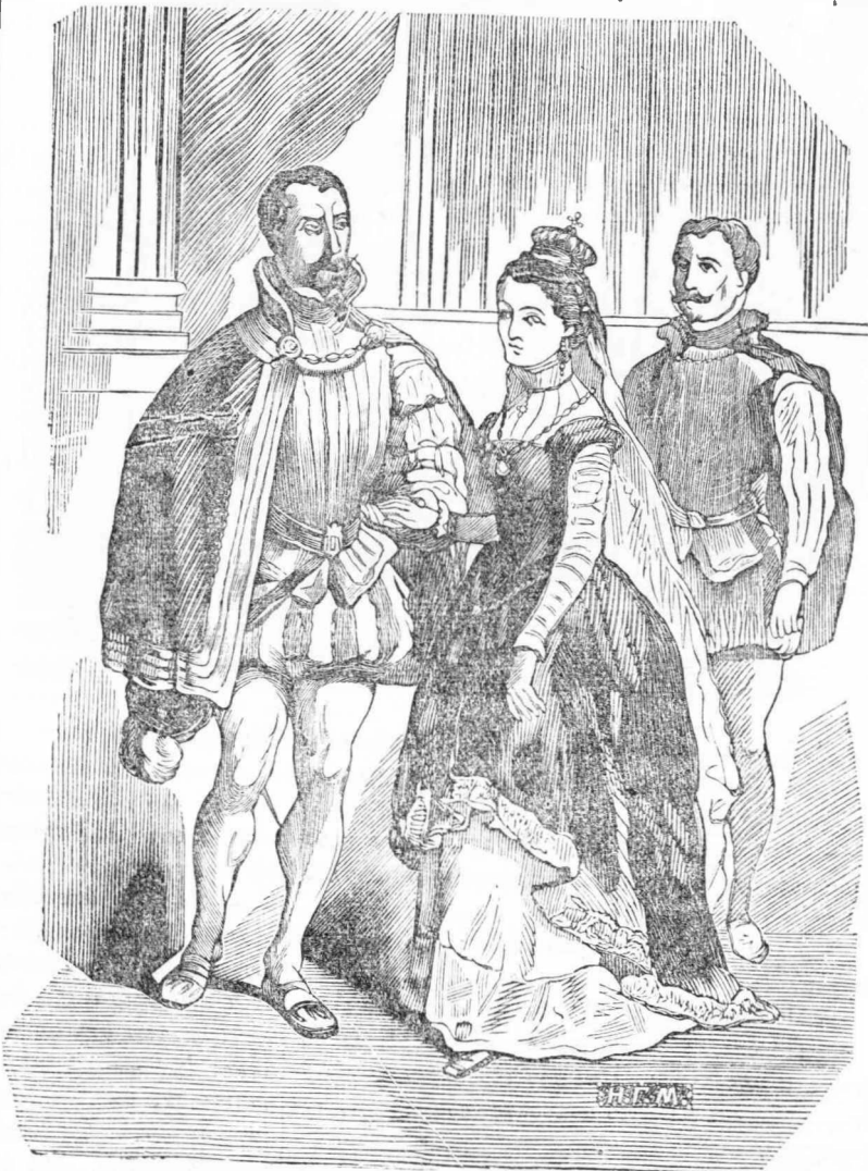
Ο δουξ του Νορθουμπερλανδ, προσπαθῶν νά πείσῃ τήν βασιλισσαν ν' άναγνωρίσῃ βασιλεία τον υιόν του.

σκοπέσῃ όλα τὰ βήματα, όλα τὰ κινήματα τῆς Ιωάννας. Κάνένα δέ άλλον δέν ένόμισεν ότι ήδύνατο πρὸς τούτο νά μεταχειρισθῆ με πλειοτέραν έπιτυχίαν, παρά τήν άχώριστον σχεδόν οὖσαν από τήν βασιλισσαν θυγατέρα του λέδην Άστιγξ· δθεν και τήν εκάλεσεν. Ερωτηθεΐσα επιμόνως ή λέδη Άστιγξ, έναντίον τῶν διαταγῶν τῆς βασιλίσσης τῆς, ένόμισεν άπρεπον νά κρύψῃ από τόν γενικόν έξαρχον του βασιλείου τό μυστηριώδες συμβάν του παρεκκλησιου, του Αγίου Ιωάννου· ή δέ διήγησις αὐτῆ έρριψεν εις πολλήν άνητυχίαν τόν δουκ, και έπεκύρωσε τήν ιδέαν του. Αί ύποψιαί του ιδίως έπεσαν επί του Σίμωνος Ρινάρ, μολονότι, όριστικῶς, δέν ήξευρε πῶς νά συνδέσῃ τὰς ύπογεύους ραδιουργίας του πονηρού πρέσβευς με τό νυκτερινόν συμβάν του παρεκκλησιου. Απέπεμψε τήν θυγατέρα του με άκριβείς οδηγίας περί του τρόπου καθ' ον έπρεπε νά ρηθμισῇ τήν διαγωγῆν τῆς, ειπὼν πρὸς αὐτήν ότι το έργον τό ύποϊον ανέλαμθανεν ήτον σπουδαίον, και άνάλογος έπρεπε νά ήναι και ή επιμέλειά τῆς, και, μετά ταύτα, ώραν πολλήν έζουθίσθη εις τὰς νέας σκέψεις, όσας έγέννησεν εις τήν κεφαλήν