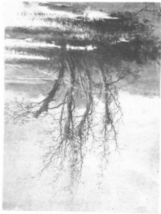
Β. ΜΗΟΚΑΤΙΛΙΑΜΠΗΣ. Το κείον Κερκίρας.