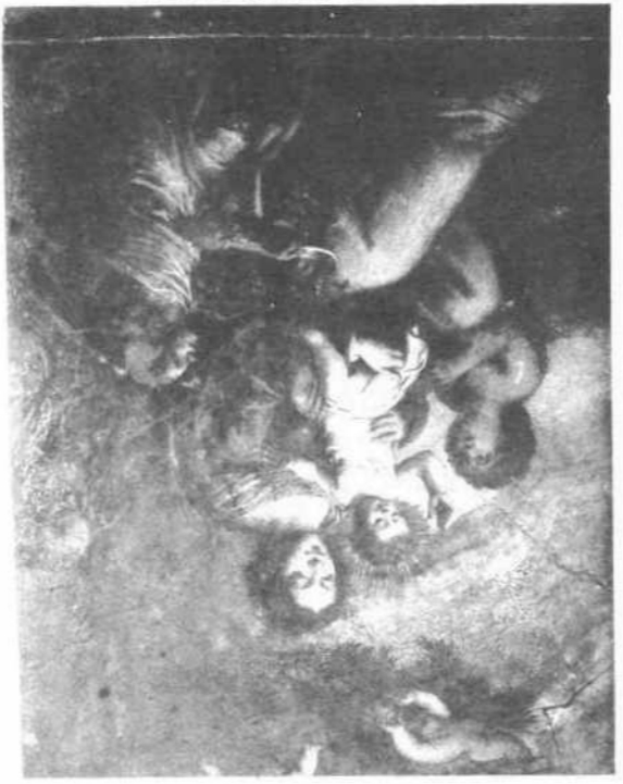
ΝΟΥΡΙΑΛΟΕ. Η άγία οικογένεια.