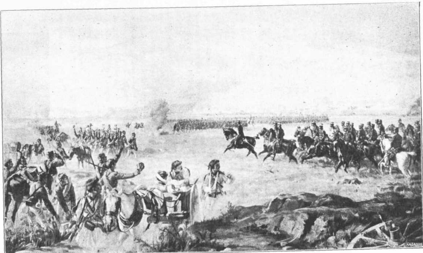
Η ΜΑΧΗ ΤΩΝ ΦΑΡΣΑΛΩΝ (1897)