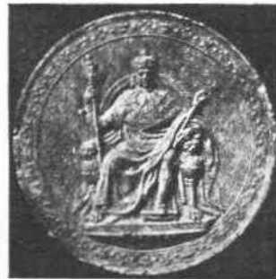
Σιγίλλον Λουδοβίκου ΙΙΙ'.

Θὰ ἦτο, οὕτως εἰπεῖν, με ἐν σιγίλλον ἀντίθετον με τοὺς κανόνας τοῦ ὁποῖου: ἡκολούθησαν μέχρι τῆς ἐποχῆς ἐκείνης, ἀλλ' ἡ μορφή τῆς ἀγαθῆς Βασιλείσεως, ἣτις βραδύτερον ἐγένετο τόσο ἀτυχῆς ὥστε νὰ παρατίθῃ τὸν βίον ἐπὶ τοῦ ἰκρίωματος, με: