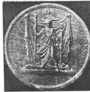
Σιγίλλον Ναπολέοντος Α'

ἀρέσκει εἰς τὸ εἶδος αὐτὸ τοῦ θειάμβου, με τὸ αὐτὸ σκῆπτρον, με τὴν αὐτὴν χεῖρα τῆς δικαιοσύνης τὴν ὁποῖαν ἐφερανὸ βασιλικὸς σύζυγός τε, ἴση με αὐτῶν, τόσο ὡς πρὸς τὴν δύναμιν ὅσον καὶ εἰς τὸν ἔρωτα! Ὁ Κάρολος Θ'