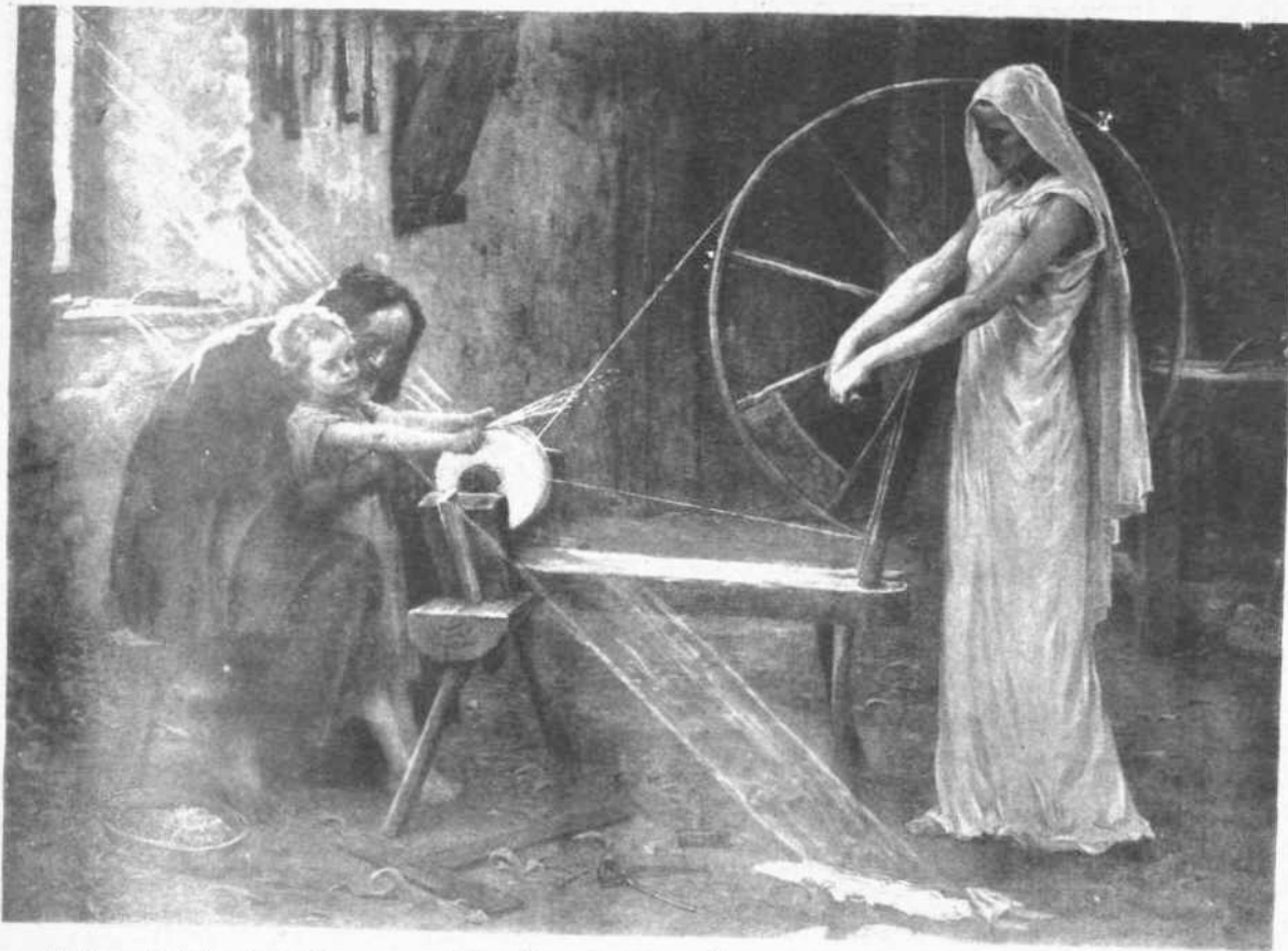
Mme V. DEMONT - BRETON.