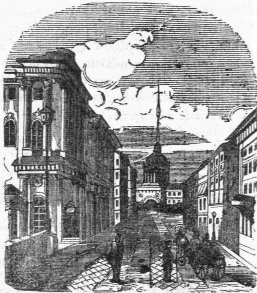
ΑΠΟΨΙΣ ΤΟΥ ΝΕΥΣΚΥ.

Πρᾶγμα ἀξιοσημείωτον! τὸ θέρος μὲ τὰς γλυκείας αὔρας του, τὰ ἄνθη, τὰ ὕδατα τὰ διαφανῆ, ὁ ἀκτινοβόλος ἥλιος, αἱ ἀστροφεγγεῖς νύκτες, τὰ ἄσπρα, οἱ περιπάτοι οἱ ἀγροτικοί, ἡ φαῖδρά καὶ ἡ τόπον πρῶτος εἰς τὰ ὑψηλὰ κλίματα ὦρα, δὲν τέρπουσι, δὲν εὐχαριστοῦσι τῆς Πετρούπολεως τὸν λαόν, ὅστις βλέπει φθάνον τὸ θέρος, καὶ δὲν ἠδύναται καὶ δὲν ἀγάλλεται, καὶ δύναται μάλιστα νὰ εἴπῃ τις ὅτι ὠφελεῖται μᾶλλον ἐξ αὐτοῦ ἢ ἀπολαύει. Ὁ χειμὼν ὑπάρχει ἡ φυσικὴ, ἡ προσφιλὴς ὦρα, τὸ στοιχεῖόν του· ὁ χειμὼν μὲ τοὺς πά-