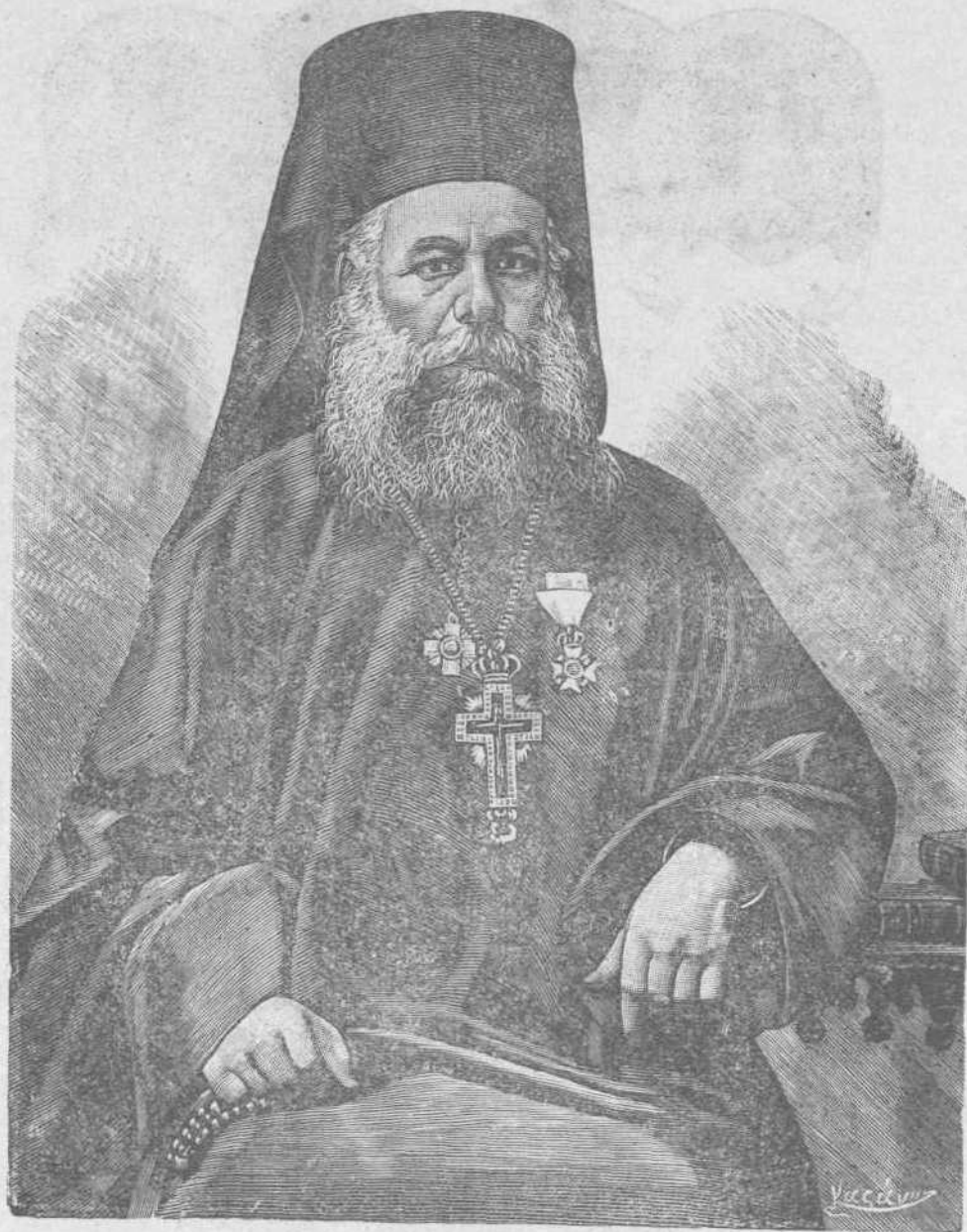
Ο ΝΕΟΣ ΜΗΤΡΟΠΟΛΙΤΗΣ ΑΘΗΝΩΝ ΠΡΟΚΟΠΙΟΣ ΟΙΚΟΝΟΜΙΑΔΗΣ