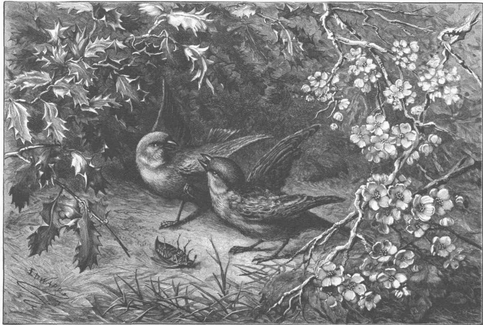
ΤΟ ΕΑΡ. Η ΠΡΩΤΗ ΛΕΙΑ.

χειρῶν. Μοὶ ἐφάνη δακρύων. Ἡ ἐμφάνισίς μου τὸν ἀφρόπτις. — Διὰ τί ἄρα γε κλαίει ὁ πατήρ μου; πλησιάζας ἐτόλμησα νὰ τὸν έρωτήσω. — Ἄλλοίμονον, ταλαίπωρον τέκνον, φοβερόν με ἀπειλεῖ δυστύχημα. — Ὅποιον δυστύχημα, πάτερ μου; — Αὔριον ἔσως θὰ με ἀποβάλουν ἀπὸ τὸ πλοῖον τοῦτο, χρεωστῶ καὶ δέν δύναμαι νὰ πλη-