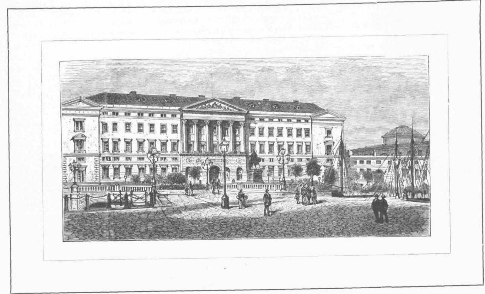
ΤΟ ΕΝ ΚΟΠΕΝΑΓΗ ΜΕΓΑΡΟΝ ΤΟΥ CHRISTIANSBORG.

φρ. Ἡ Ἐπιτροπὴ εἰς τὴν, κατόπιν παρατεταμένων πειραμάτων, κατέδειξε τ' ἀποτελέσματά του, ἐπεδεδείωσεν, ὅτι ἐκ 42 ἐνοφθαλμιθέντων κύων, 23 ἐπροφυλάχθησαν τοῦ ἐκ τῆς λύσσης τοῦ, ἐνθ' οἱ ἐπίλοιποι 19, οἵτινες δὲν ἐνοφθαλμίσθησαν κατόπιν ὀγγματός λυσσῶντος κύνου, ὑπέστησαν τὰς ἐκ τῆς νόσου συνέσεις. Εἰς τὰς λεπτομερείας καὶ τὴν πορείαν τῶν καθ' ὑπερβολὴν λεπταλέπτων περὶ ὑδροφοβίας ἐρευνῶν αὐτοῦ, ἄς ἀνακοίνωσεν ἐν τῇ ἐν Κοπενάγῃ τῇ 11 Αὐγούστου διεθνῇ Ἱατρικῇ Συνεδρίῳ, δὲν δυνάμεθα ἐνταῦθα νὰ εἰσέλθωμεν. Μνημονεύομεν μόνον ὅτι ἔλαβε πρὸς ἐνοφθαλμισμόν νεορικήν οὐσίαν (τοῦ ἐπιμήρους μυσσοῦ) ἐκ κυνῶν θανάτων ἐκ λύσσης, καὶ ὅτι, κατόπιν πολλῶν ἐπὶ πύθκων πειραμάτων, ἀπέκτιξε ἐν λίαν προφυλακτικῶν πρὸς ἐνοφθαλμισμόν. Ἡ Ἐπιτροπὴ, ὡς εἶπομεν, ἐπεκύρωσε τὰς ἐρεῦνας του καὶ τ' ἀποτελέσματα ἔκρινε λίαν εὐνοϊκῶς· ἤδη θὰ ἐπιληφθῇ ἡ ἰδία διὰ πειραμάτων τὴν διαίρεσιν τῆς προφυλακτικότητος. Εὐέλπιστοῦ-