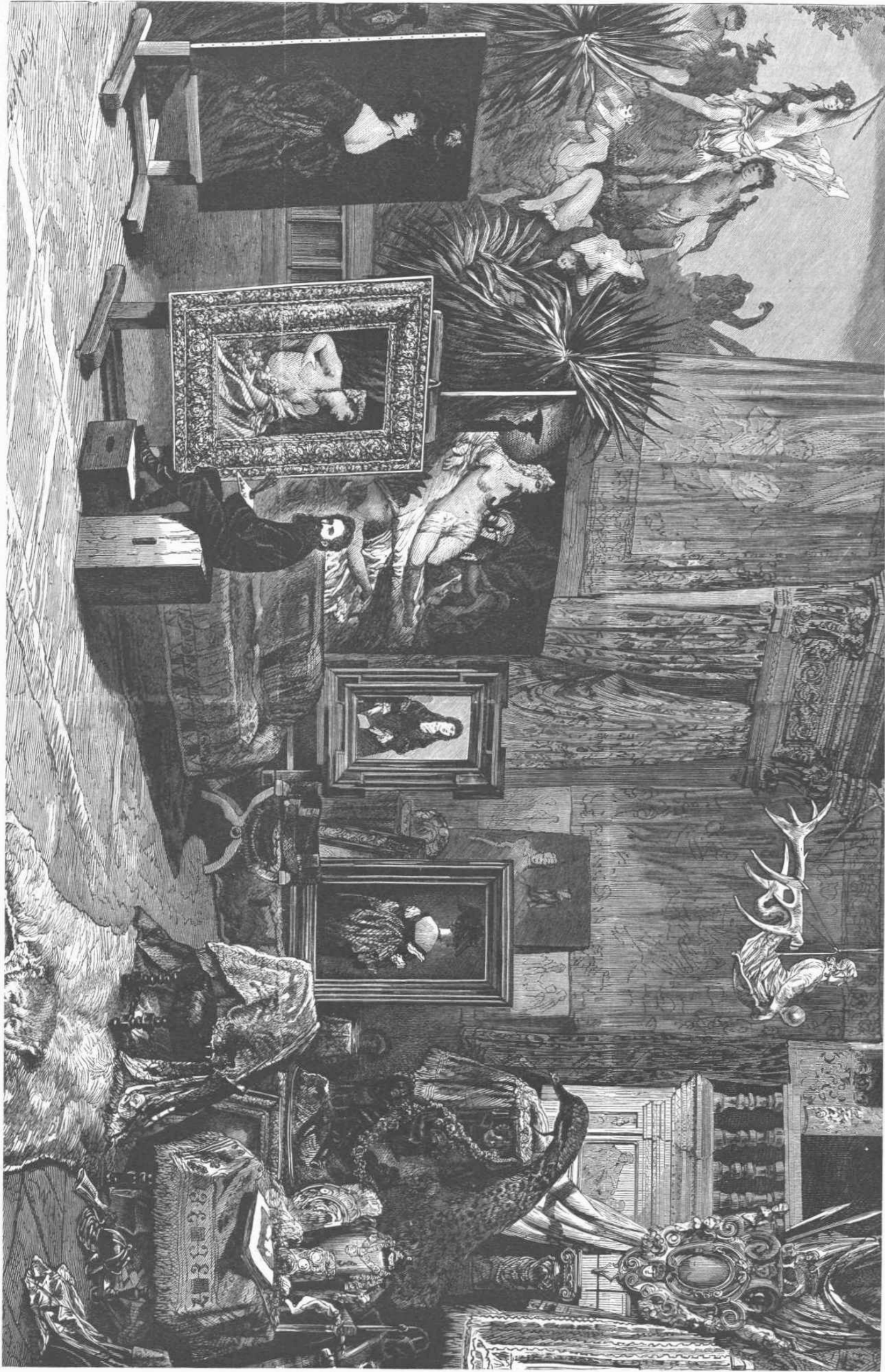
ΤΟ ΕΡΧΟΜΕΝΟΝ ΤΟΥ ΜΑΚΑΡΙΟΥ ΕΝ ΒΙΩΝΗ.