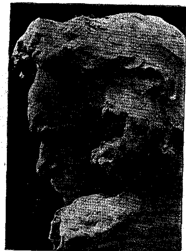
ΜΠΕΤΟΒΕΝ ὑπὸ Naoum Aronson