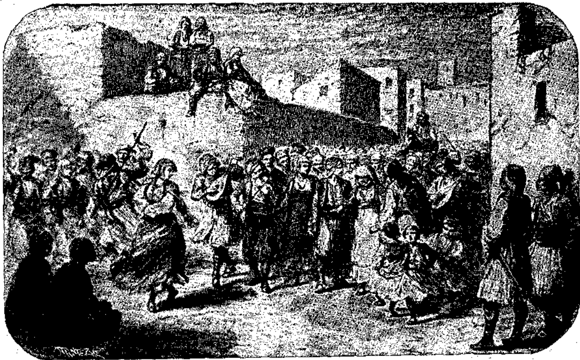
Ἀθηναϊκὸς γάμος κατὰ τὸ 1840.

ρια, τοὺς τρεῖς τουρκοφάγους Σουλιῶτες νὰ πα- γαίνουν ξέγνοιζοται καὶ λαμπροφορεμένοι στὴν ἀγκυλιὰ τοῦ θανάτου κι' ἡ ἀδυναμία του, ποῦ δὲν μποροῦσε νὰ τοὺς τὸ εἶπῃ, γιατί ἐν τοὺς τὸ ἔλεγε χανόνταν στὴν στιγμή κι' ἐκείνοι κι' αὐτὸς μαζὺ τους, ξέσπασαν σ' ἓνα εἶδος τραγοῦδι, τρα- γοῦδι γλυκόφωνο, ποῦ οἱ στίχοι του ἀντισχεδίου εἶταν ἀπαύγασμα διαφόρων ἔθνικων τραγουδιῶν ποῦ τραγουδοῦσε στοὺς γάμους, στὰ πανηγύρια καὶ στὲς διασκεδάσεις τῶν μπένδων καὶ τῶν πασιαδῶν τοῦ Γιαννίνου καὶ τῆς Ἀρβανιτίας. Ἄκουμπιμένο πανήγυρμα σ' ἓνα μεγάλο κο- τρῶνι καὶ καμώνοντας πῶς δὲν πρόσεχε καθόλου στοὺς διαβάτες, ποῦ περνοῦσαν ἀπὸ μπροστά του, ἄρχισε τὸ τραγοῦδι μὲ μιὰν ἀγγελικὴ φωνή, σπα- νία σὲ κάθε τραγουδιστῇ, κι' ἔλεγε μ' ἐκεῖνο τὸ τραγοῦδι :