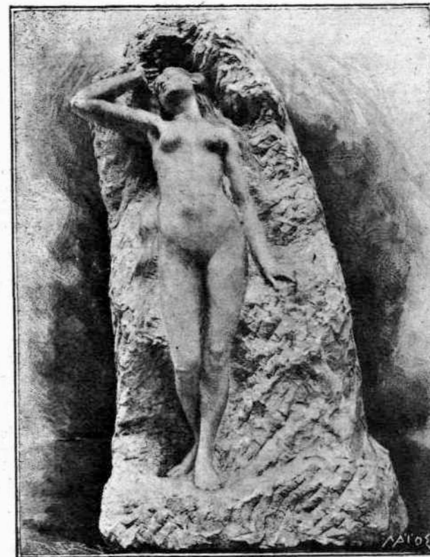
Γ. Μπλόδυμλερ Τὸ ζύνημα τῆς φύσεως

Εἰς τὸ χωρίον ποὺ κατοκεῖ ἴδουσε μίαν βιβλιοθήκην, εἰς ἣν ἐπρεπε νὰ πληρώσῃ κανεὶς διὰ νὰ εἰσέλθῃ. Εἰς τὴν εἰσοδὸν ἦτο ἀναρτημένη ἡ ἐξῆς ἐπιγραφὴ. «Τὰ χροῖματα παραδίδονται εἰς τὸν ἴδιον Τουαῖν, ὥστε φόβος καταχρήσεως δὲν ὑπάρχει.»