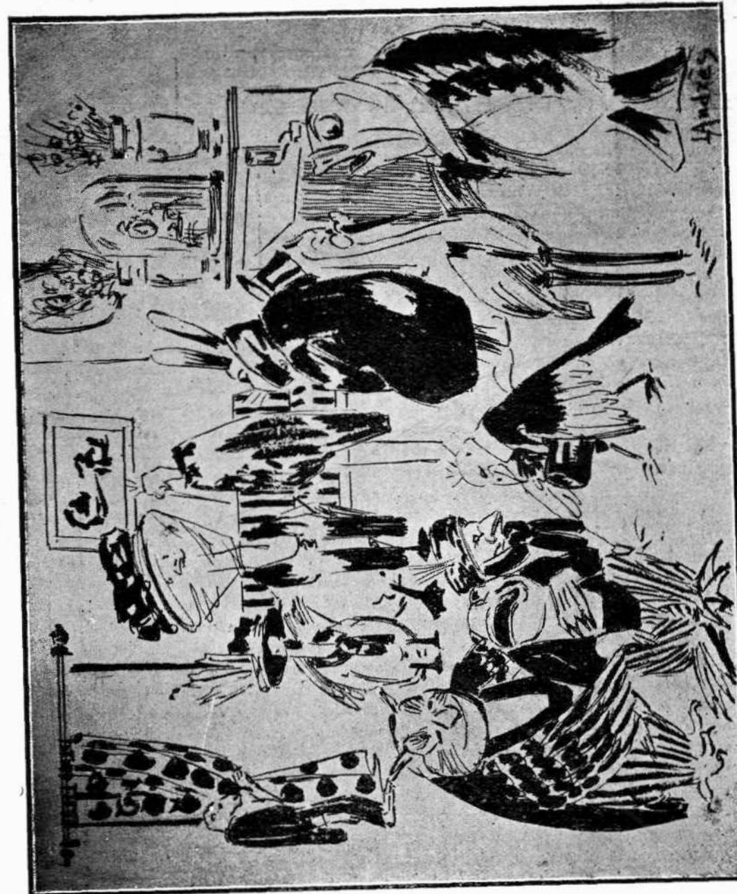
Σχοροῦ ἑξ ἑσπέρῃ II.