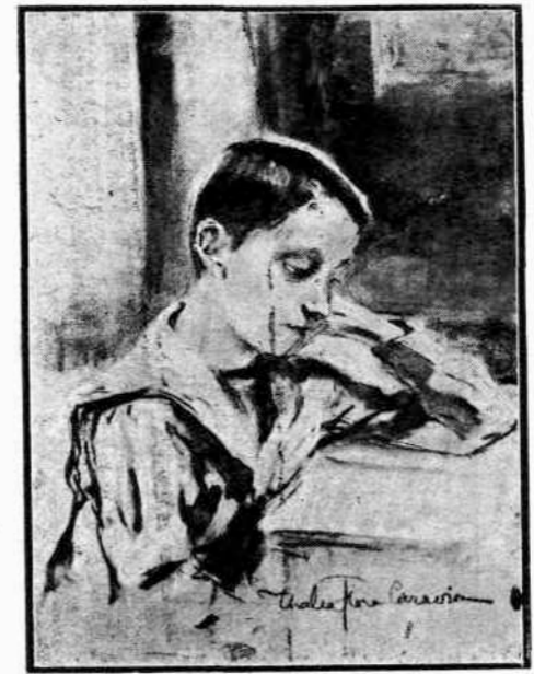
Θ. Φλωρᾶ-Καραβία Ἀνάγνωσις