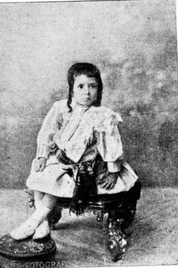
1) Εἰκόνα τῶν ἐδημοσιεύσασεν εἰς τὸ 79 τεῦχος τῆς «Πινακοθήκης».