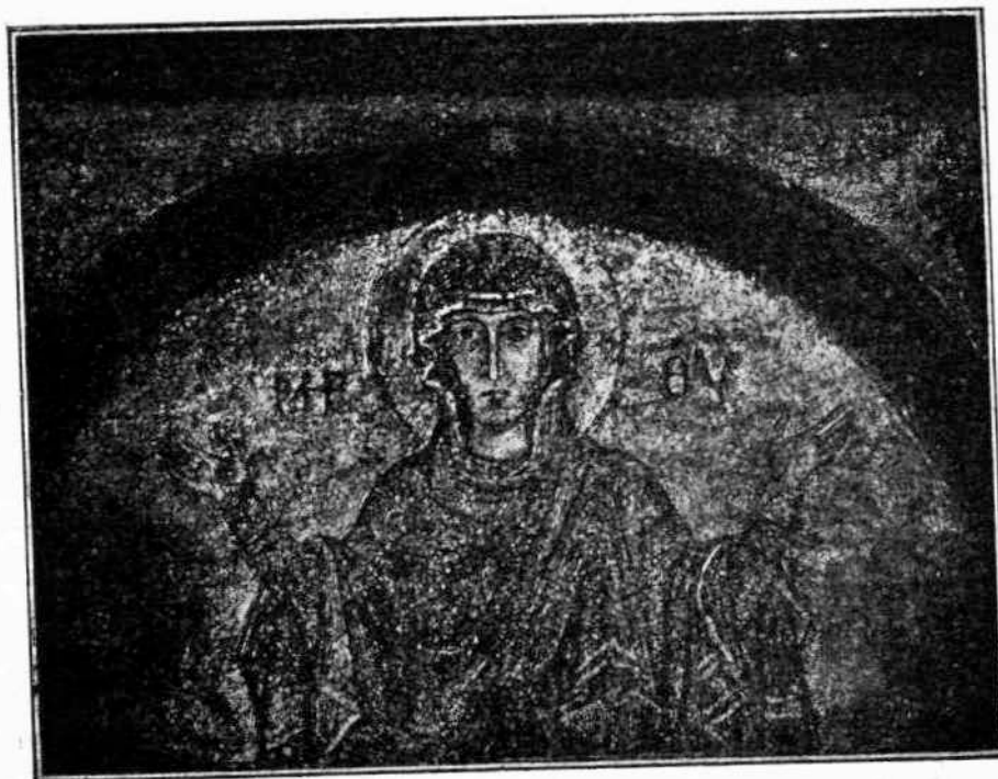
Ἡ εἰκὼν τῆς Παναγίας (Ἐν τῷ νάρθηκι—Μωσαϊκόν.—Εἰκὼν Γ')