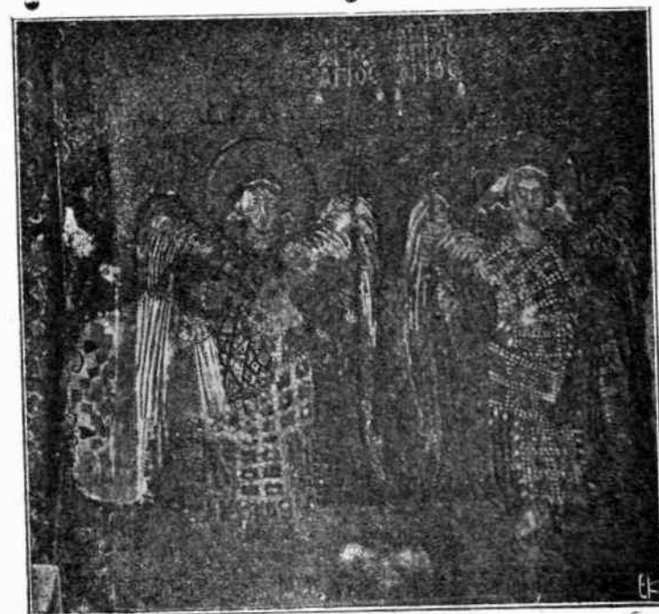
Ἄγγελοι τοῦ ἱεροῦ. (Μωσαϊκόν.—Εἰκὼν Δ')