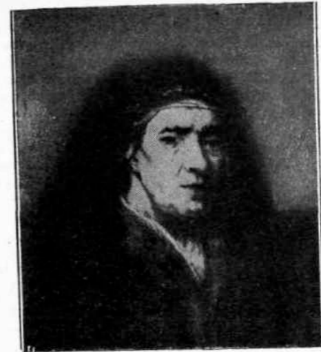
Rembrandt Προσωπογραφία Γραίας (Δωρεὰ Σ. Σίγου)