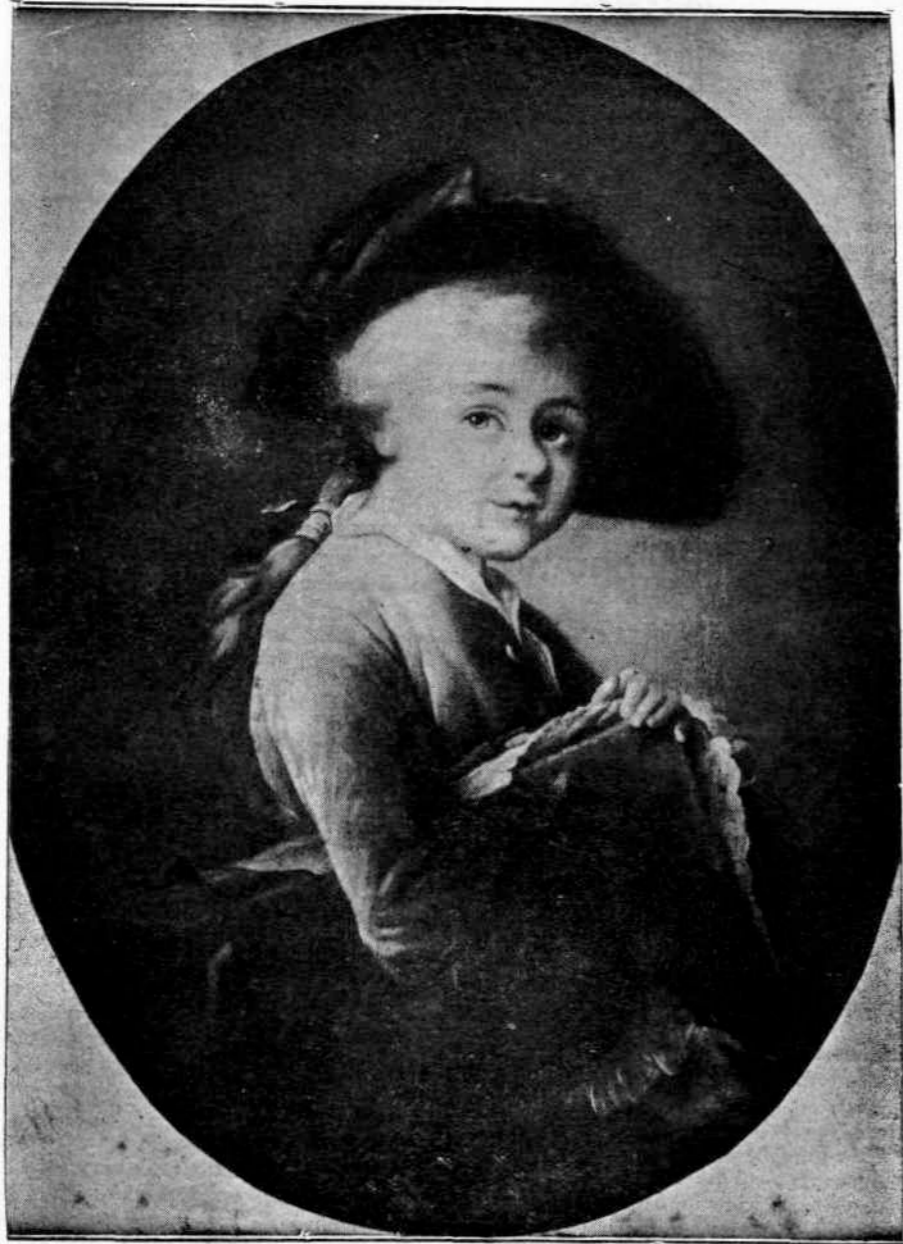
Σπουδή του Chardin