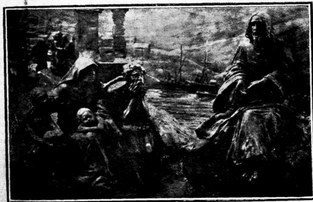
Ο ΧΡΙΣΤΟΣ ΔΙΔΑΣΚΩΝ