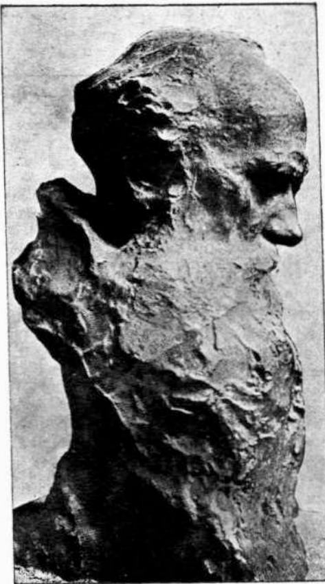
N. ARONSON. Προτομή Τολστόη

Ἐπειτα ἐπονται αἱ αἰθούσαι μετὰ μνημεῖα τῆς ἐν Γερμανίᾳ, Γαλλίᾳ καὶ Ἰλλυρίᾳ Ρωμαϊκῆς κατοχῆς. Κατόπιν αἱ αἰθούσαι τῆς Ἀχαΐας. Εἰς τὸ κέντρον κυριαρχεῖ τὸ κιονόκρανον τοῦ μνημείου τοῦ Παύλου Αἰμιλίου, νικητοῦ τῆς περιφύμου μάχης τῆς Πίδνας. Ἐκεῖ πλησίον εὐρίσκεται τὸ περίφημον ἱερὸν τῆς Ἀγκύρας ἐν Μικρᾷ Ἀσίᾳ, τὸ ὁποῖον, ὡς γνωστὸν, περιέχει τὴν διαθήκην τοῦ Αὐγούστου. Ὑπάρχουν μνημεῖα τῆς Καρχηδόνας, Κυρηναϊκῆς, Περγάμου, Παλμύρας καὶ ἄλλων μερῶν, εἰς τὰ ὁποῖα ἐξηπλώθη ἡ θριαμβευτικὴ ἐξουσία τῆς ἀρχαίας Ρώμης.