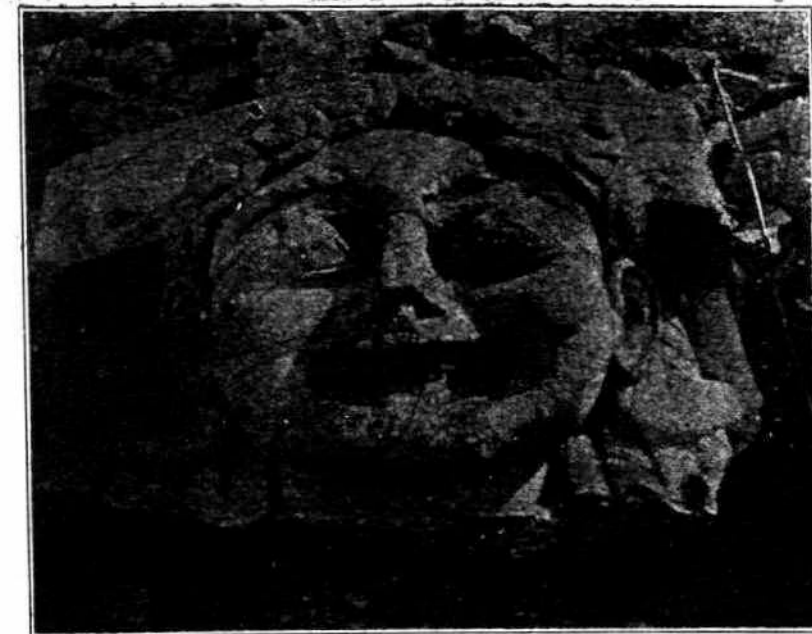
Άπό τά άνασκαφάς της Κερκύρας