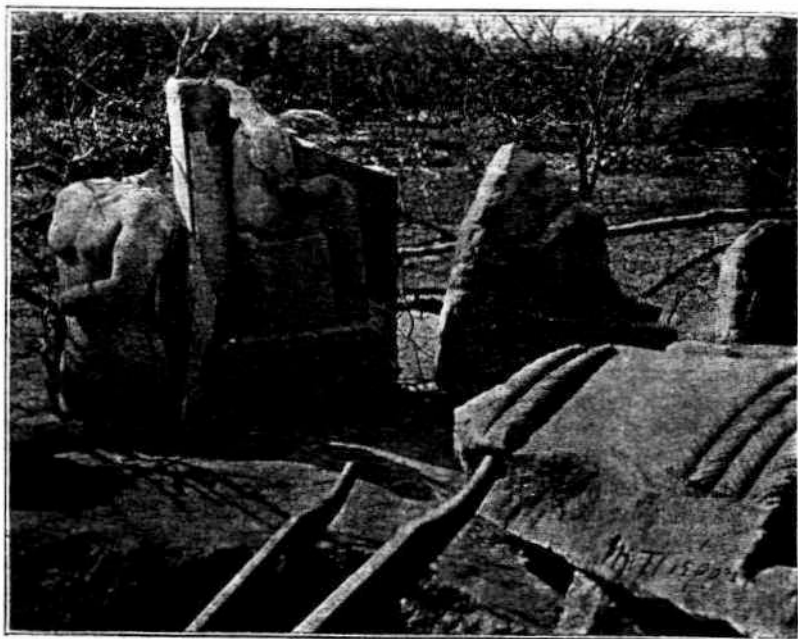
Άπό τά εύρήματα της Κερκύρας.

4.) Άνάγλυφον παριστών νεκράν κόρημ,θεάν,