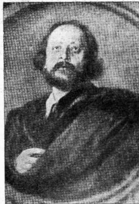
Ο συγγραφέας Παύλος Χιύζις

για. "Όλος ο βίος ήταν ένα βιβλίο πού έφυλλομέτρησα και τα βιβλία ήταν ή δική μου ή ζωή. Κι' εδίαβασα και έμελέτησα. Κι' είδα έμορφα πράγματα, έμορφες ιδέες. Κι' όταν έγύριζα γύρω μου δεν τες εύρισκα. Κι' όλοένα εδίαβαζα, και συνήτησα πραγματικές αλήθειες, όμορφα μέσα στο άσχημον κι' άσχημο μέσα στο καλό. Και ή ζωή μου φάνηκε πού γνώριμη. Είδα διαφορές πολλές και αντίφάσεις μέσα στην ίδια την σελίδα ενός βιβλίου, μά σε όλα μιιά λέξι κοινή, παντού για τη γυναίκα. Και κατάλαβα πώς είναι ένα κομμάτι αναπόσπαστο απ' τη ζωή.