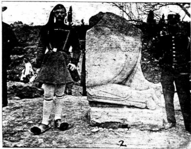
2.—Πρόσθιον μέρος του λέοντος

γείου της Παιδείας ο έφορος κ. Βερσάκης, όστις εξαγαών το ανάγλυφον εκ της γής, ήρχισε κατά την 29 Μαρτίου άνασκαφάς εις τό μέρος τοϋτο, αΐτινες έντός όλίγων ήμερών έφερον εις φώς πάντα σχεδόν τά ανάγλυφα του δυτικού άετώματος του ναού. Ταύτα είναι 1) Μία γοργώ έχουσα ύψος από της κεφαλής μέχρι των γονάτων μ. 2.80 περίπου. Φέρει δωρικόν χιτώνα κοσμούμενον κατά τό κράσπεδον διά μαιάνδρου, εις δέ τόν λαϊμόν διά κυματίων, και φθάνοντα μέχρι των γονάτων. Η κόμη απολήγει εις ύψεις εξικνουμένους εκατέρωθεν μέχρι της όσφύος, περιζώσμένης και ταύτης δι' όψεων. Η γοργώ παρίσταται πτερωτή, πτερωτοί δέ