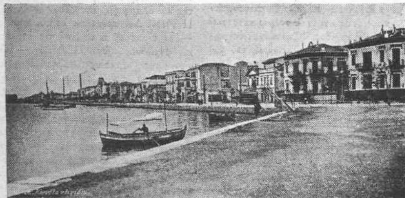
Η νήσος Ρόδος, εν η οι Έταλοι τρομοκρατούσι τους Έλληνας κατοίκους.

Διά να γίνη μία τοιζύτη λιθογραφία δέν χρειάζονται πολλά πράγματα. Πρωτον δέν χρειάζεται καλλιτέχνης. Διότι ο καλλιτέχνης κάτι θα δημιουργήση καλόν, το δε καλόν δέν το πολυενοούν αι λαϊκάι μάζαι· χρειάζεται σχεδιαστής τολμηρός εις γραμμάς και τολμηρότερος εις χρώματα. Χρειάζεται φαντασία άγαλίνωτος, ούτε σκια δε οπογραφικής άκριθείας. Άπεικονίζονται λ. χ. μάχαι. Πρέπει να κυριαρχούν τα εύζωνάκια. Όλα τα πτώματα θα είναι Τουρκικά. Πρέπει να φαίνεται η Έλλ. σημαία. Βουνά και πεδιά-