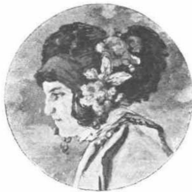
Μακεδονίς νύφη Πίναξ Ν. Φερεκάδου