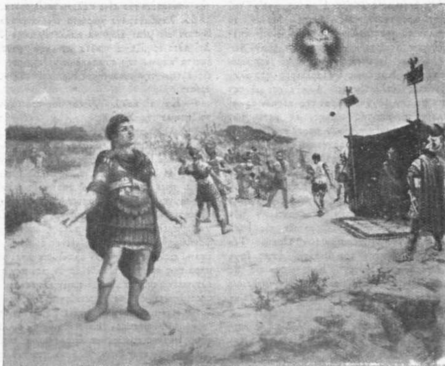
ΤΟ ΟΡΑΜΑ ΤΟΥ ΚΩΝΣΤΑΝΤΙΝΟΥ