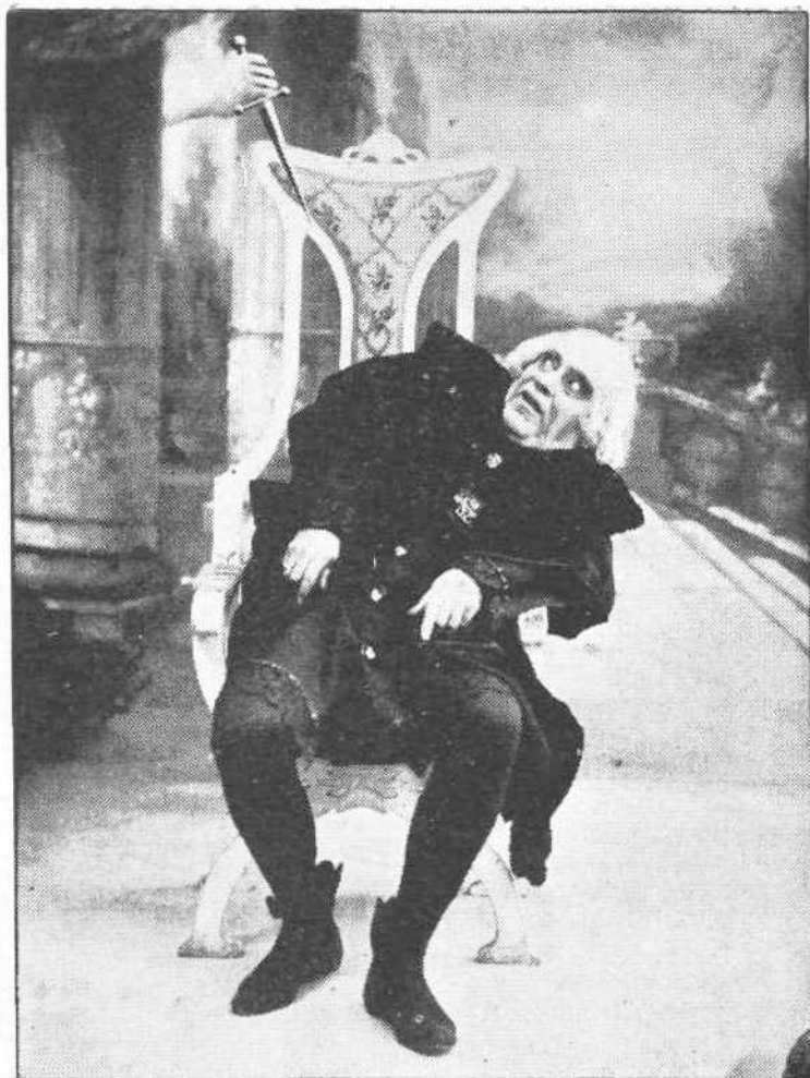
ΕΔΜ. ΦΥΡΣΤ ως Λουδοβίκος ΙΑ' (Πράξις Γ')

Έκ των έργων του Σκότ, η μεγάλη εικόνα του Βασιλέως ή παριστώσα αυτόν έφιππον επί γαβύρας ηγοράσθη από τον σταυλόαρχο κ. Υψηλάντην αντί 15 000 φράγκων. Έτέρα εικόνα του Βασιλέως με τον υποστράτηγον κ. Λούδομανν ηγοράσθη από τον κ. Σταματ. Βαφειάδακη αντί 6000.