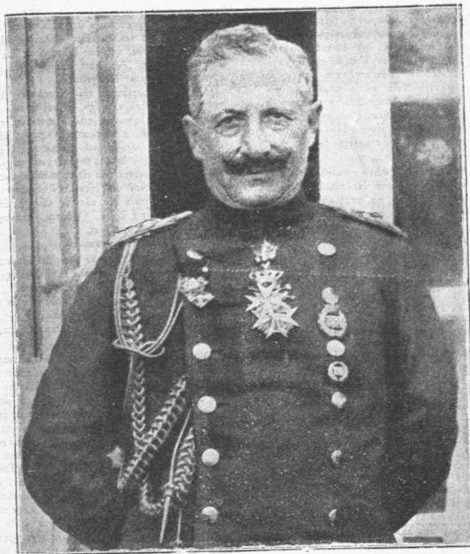
Ο ΑΥΤΟΚΡΑΤΩΡ ΓΟΥΛΙΕΛΜΟΣ ὁ Ὑψηλὸς τῆς Κορκῆρας ἐταιροκράτης