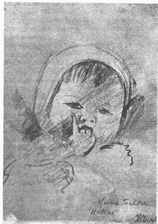
Ή κόρη μου «Ελλάς»