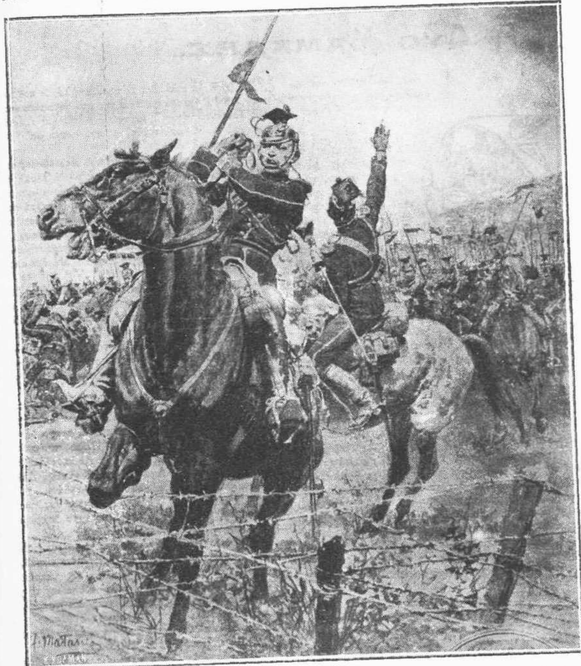
Οὐλάνοι συναντῶντες Γαλλικά συρματοπλέγματα και σταματώντες.

Ἡ καταστροφή τῆς Λουδαίν και τῶν Ρῆμων ἐπεισόδιον τῆς ζωῆς τοῦ Γωσήφ τοῦ Γαριβάλδη, συμβᾶν κατὰ τὴν πολιορκίαν τῆς Ρώμης, τὸ 1849. Ὅταν ἐπολιορκεῖτο ή πόλις, πρὸς ἐξεύρεσιν μετάλλου διά κατασκευὴν τηλεβόλων, διατάχθη ὅπως χυθῶσιν οἱ ἐξ ὄρειχαλκου κώδωνες τῶν ἐκκλησιῶν τῆς αἰωνίας πόλεως. Μοναχὸς τις τοῦ μοναστηρίου τοῦ Ἁγίου Ὀνουφρίου ἐσταμάτησε παρὰ τὸν Ἰανίκολον λόρον τὸν ἵππον ἐφ' οὗ ἐπέβαιναν ὁ Γαριβάλδης και εἶπε πρὸς τὸν μέγαν ἐκεῖνον ἄνδρα: «Σὰς παρακαλῶ, μὴ ἐπιτρέψῃτε νὰ καταστραφῶσιν οἱ κώδωνες τοῦ μοναστηρίου τοῦ Ἁγίου Ὀνουφρίου. Ἐνθ' ἀπέθανεν ὁ Τορκουάτος Τάσσο». Ἡ ποιητικὴ φύσις τοῦ Γαριβάλδη, ή ἀνάμνησις τοῦ ποιητοῦ τῆς «Ἀπελευθερωθείσης Ἰερουσαλήμ», ὅστις τόσην ἐπιρροὴν ἔσχεν ἐπὶ τοῦ πνεύματος τοῦ σκαπανέως τῆς ἐλευθερίας ἠνάγκασαν τὸν στρατηγὸν ν' ἀνακράξῃ «Ὅυδεὶς νὰ ἐγγίση τοὺς κώδωνας οἱ ὁποῖοι ἐσήμανον τὸν θάνατον τοῦ Τορκουάτου Τάσσου!»