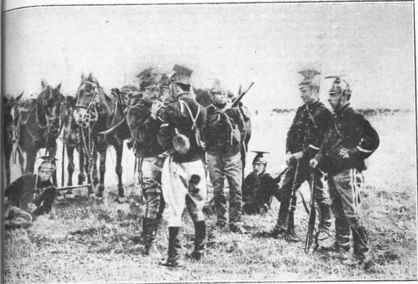
Βέλγοι ιππείς, άναπαύομενοι μετ' έπέλασιν κατά των Γερμανών.

Άλλο πολεμικόν μνημεϊον το όποϊον είναι πολύ άνώτερον της προηγούμενης στήλης, άναμνει τον φιλό- τεχνον, όστις θὰ το παρηγγείλῃ. Στήριζόμενος επί κί- ονος μεγάλου εις λείων, σύμβολον ίσχύος, έν στάσει άναμονής, είναι έτοιμος να όρμήσῃ κατά των έχθρων. Το στόμα του δεικνύει τους έτοιμούς να ζεσχίσουν ο- δόντας του, ένθ τον δεξιόν έμπρόσθιον πόδα κρατεί ύψηλά παρὰ την κεραλήν, ένα δια των όνύγων του κα- ταπαράξῃ τον τύραννον. Άνωθεν, δύο Έλληνικαί ση- μαϊκῆ, χριστι τοποθετημένα, ένθ εις το άνοιγμα, το όποϊον σχηματίζουν επί της στήλης ύπάρχει έν με- ταλλίω άνάγλυφος η μορφή του άιμνήστου Βασιλέως Γεωργίου. Εις την κορυφή, η Νίκη γονυπετής, άπο- θέτουσα ένα στέφανον δάφνης, έτοιμη να πατάξῃ δια νέας