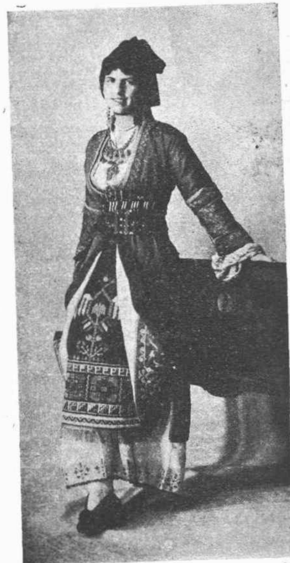
Ἡ Α. Β. Υ. ΠΡΙΓΚΗΠΙΣΣΑ ΕΛΕΝΗ φέρουσα Μακεδονικὸν ἔνδυμα.