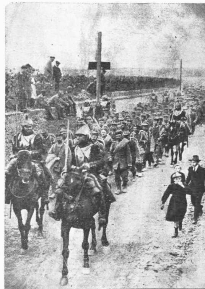
Γάλλοι Δραγόνιοι ὀδηγοῦντες Γερμανοὺς αἰχμαλώτους ἀπὸ τὴν Ἀρμαντιέρ εἰς τὸ ἐσωτερικὸν τῆς Γαλλίας