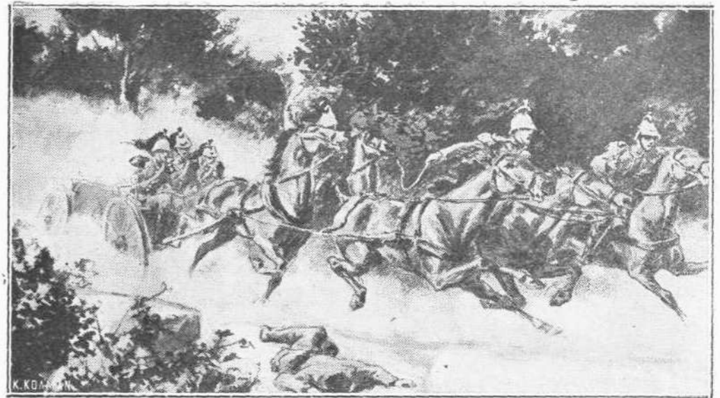
Γερμανικὸν πυροβολικόν, ἐμπεσὸν εἰς τεχνητὴν πλημμύραν