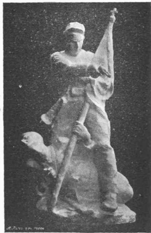
Σ. Παρλιάρου 'Η ὑπεράσπισις τῆς σημαίας