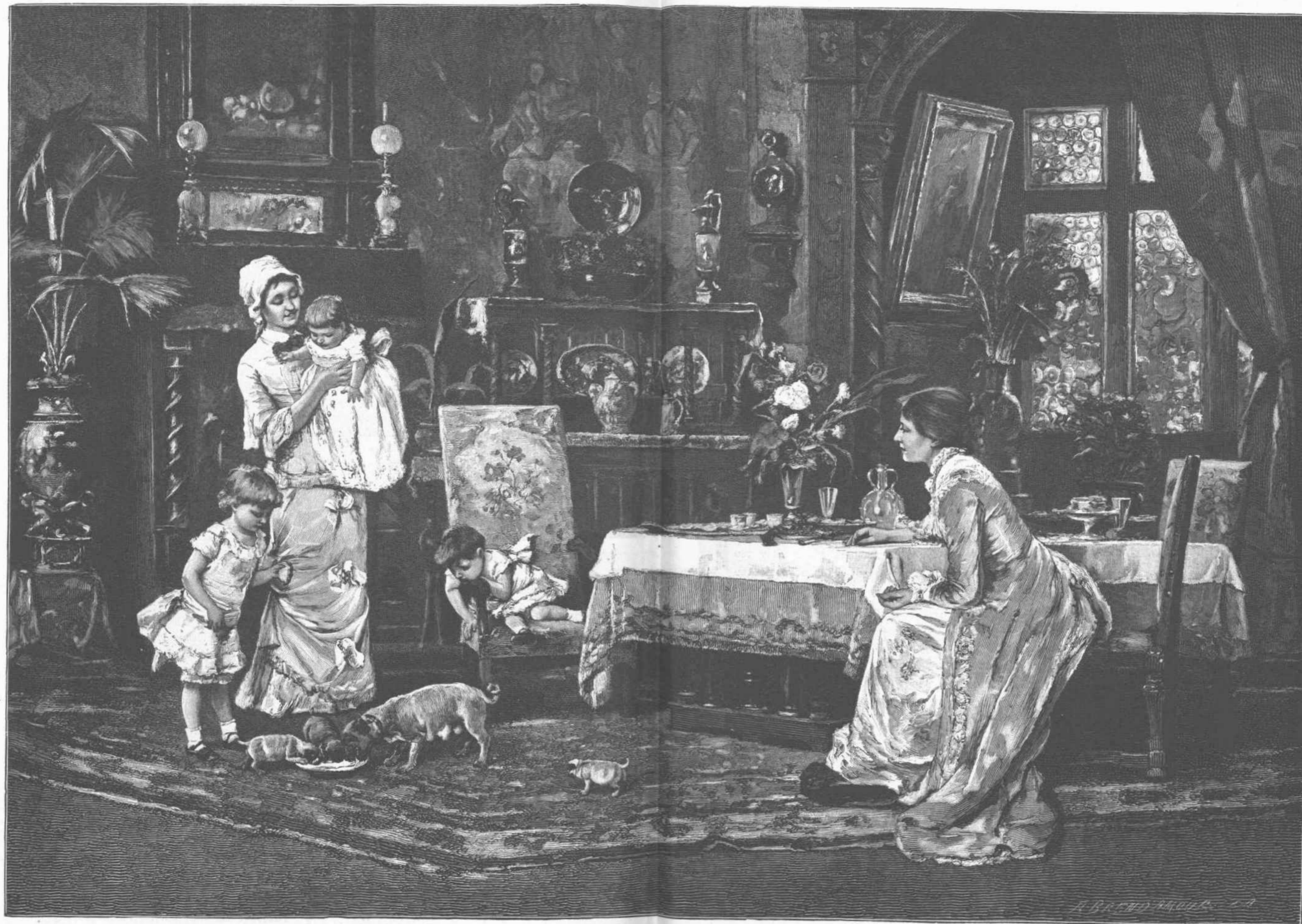
ΔΤΟ ΟΙΚΟΓΕΝΕΙΑ. (Είξων Μυκάζου.)