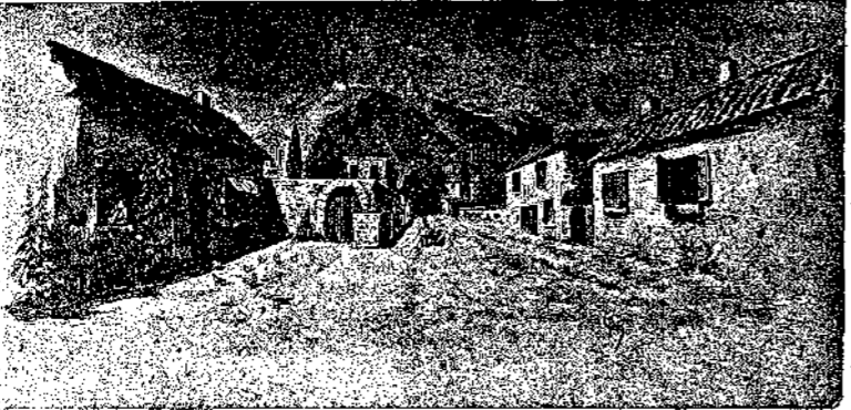
Η ΠΑΛΙΑ ΚΟΡΙΝΘΟΣ

Έν έτει 1858 φοβερό; σεισμός κατέστρεψε την επί των έρειπίων της άρ-χαίας και φιληδόνου Κο-ρίνθου πολίχνην, νέος δε συνοικισμός άποκατέστη εις την αυτήν παραλίαν. Όλίγοι μόνον εκ των κα-τοιικών της ήρειπωμένης πόλεως πιστοί έμμένοντες εις την πατρίαν έστία; έκτισαν τους οικίσκους των επί των παλαιών έρειπίων.