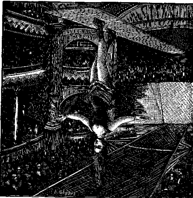
Σχ. 1.—Βάδισμα ἐπὶ τῆς ὀροφῆς. Ἐκτελεσθὲν ὑπὸ Ἀμερικανίδος ἀκροβάτιδος ἐν δημοσίῳ θεάματι διὰ μέσου δύο πνευματικῶν δίσκων.

Οἱ κάτοικοι διαφόρων πόλεων τῆς Ἀμερικῆς ἐγένοντο κατ' αὐτὰς θεαταὶ περιέργου καὶ πρωτοφανοῦς θεάματος, τὸ ὁποῖον ἀσμένως σπυδόμενοι νὰ μεταδώσωμεν τοῖς ἡμετέροις ἀναγνώσταις. Πρόκειται δέ, ὡς ἐμφαίνεται ἐν τῇ ἔναντι ἡμῶν εἰκάνῃ, ἢν ἀνετυπώσωμεν ἐκ τοῦ Scientific American, περὶ βαδίσματος ἐν τῇ ὀροφῇ ἐκτελεσθέντος ἐπανειλημμένως καὶ ἐπιτυχῶς διὰ τῆς ἐφαρμογῆς τῶν περὶ ἀτμοσφαιρικῆς πίεσεως νόμων. Τὸ ἔδαφος ἢ μᾶλλον ἡ ὀροφή, ἐφ' ἧς μία νέα ἀκροβάτης ἐβάδισε, ἀποτελεῖται ἐκ σανίδος 8 μέτρων μήκους ἐντελῶς ὀμαλῆς καὶ ἐστιλβωμένης.