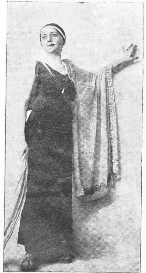
Ἡ Μαρίκα Κοτοπούλη ὡς Μήδεια

τρῶν τῆς ἐποχῆς, οἵτινες ἀνευ βοήθειας μικροσκοπίου, μᾶς ἐκληροδότησαν θαυμασίας περιγραφὰς διαφόρων νόσων. Ἐβραϊκαὶ τινες γὰρ κιναι λυχνίαι περιέχουσι ἐργασίας τοῦ ΙΣΤ' καὶ ΙΖ' αἰῶνος πρὸς χρῆσιν κατὰ τὸν ἑορτασμὸν τῆς ἑορτῆς τῶν Μακκαβαίων, κηροπήγια ἐξ ὄνυχος, εἰς μεγεθυντικὸς φακὸς τεραστίων διαστάσεων χρησιμεύον πρὸς αὐτόματον ἀφῆν διὰ τῆς συγκεντρώσεως τῶν ἡλιακῶν ακτίνων, μία λυχνία μετὰ μηχανισμοῦ ὄρολογίου διὰ τὴν ἀνύψωσιν τοῦ ἐλαίου ἐν τῷ δοχείῳ, ὅπερ ἡ θραυλλίς δὲν ἠδύνατο ἐπαρκῶς νὰ κομίσῃ πρὸς τὰ ἄνω, καὶ τέλος εἰς κρυστάλλινος ἐπηγερωμένος πολυέλαιος παμμεγίστων διαστάσεων καὶ ἐξαισίας τέχνης ἐκ τοῦ μεγάλου Ρότσιλδ, ἐπισύρουσι τὴν περιεργίαν τῶν ἐπισκεπτῶν τῆς διὰ τὴν μελέτην τῆς ἀναπτύξεως τῶν μέσων τοῦ φωτισμοῦ ἀνὰ τοὺς αἰῶνας, λίαν ἐνδιαφερούσης ταύτης ἐκθέσεως.