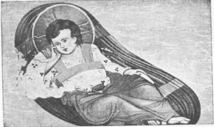
Ο Ίησους του Πανσελήνου.

ΟΦΘΑΛΜΟΛΟΓΙΚΗ ΚΛΙΝΙΚΗ ΣΠΗΛΙΟΥ Ι. ΧΑΡΑΜΗ ΟΔΟΣ ΜΕΝΑΝΔΡΟΥ 27 Τμήμα ἐσωτερικῶν ἀρρώστων διὰ θεραπειὰς καὶ ἐγχειρήσεις ὄλων τῶν ὀφθαλμικῶν νοσημάτων.