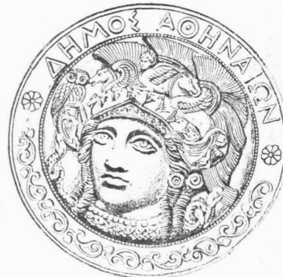
Η νέα σφραγις του Δήμου Αθηναίων

πρός ύπόδειξιν τοιούτου τύπου, ως τοιούτον δ' ούτος εξέλεξε την έναντι δημοσιευομένην εικόνα περί ης λέγει εν τη έκθέσει του προς τόν Δήμαρχον τα έξης: «Η κατ' ένώπιον κεφαλή της Αθηνάς της νέας σφραγιδος έλήθη εκ περιφήμου χρυσού νομισματοφόρου δίσκου Αττικής τεχνοτροπίας, εύρεθέντος μέν εν Παντικαπαίω, άρχαία Έλληνική πόλει της νοτίου Ρωσίας, φυλαττομένου δε νυν εν τω Αυτοκρατορικω Μουσείω Эрmitage της Πετρούπολεως. Εικόνιζει δε την κεφαλήν ουχι, ως κοινως νομιζεται, της περιφήμου χρυσελεφαντινης Παρθένου Αθηνάς του Φειδίου, της εν τω σηκω του Παρθενώνος ιδρυμένης, ης το κράνος εκόσμου Σφιγγς, δύο Πήγασοι, δύο Γρύπες και όκτώ κεφαλαί ίππων, αλλά—ως δεικνύουσιν ή επί του προσώπου αυτής εκφραζομένη δια της συστολής των χειλέων ισχυρά όργη, ή ζωηρά στροφή της κεφαλής και κυρίως ή άριστερά εις το βάθος ύπερ και παρά την περικεφαλαίαν της Αθηνάς ήσυχως έμφωλεύουσα μεγάλη γλαύξ—την κεφαλήν της συγχρόνως ύπό του αυτού μεγάλου καλλιτέχνη ποιηθείσης δια το ανατολικόν άίτωμα του Παρθενώνος κολοσιαιας μαρμαρινης Αθηνάς Παρθένου της έριζούσης, παρά την Ιεράν ελπίαν