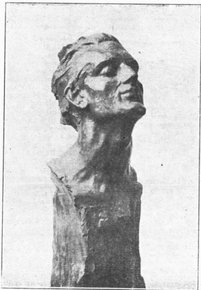
“Εκστασις, προτομή υπό Ν. Στεργίου