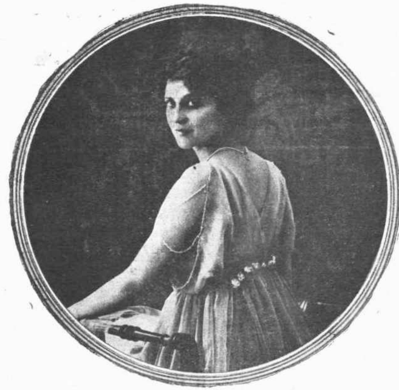
Ἡ Παρισινὴ καλλιτέχνης Yvette Andreyor Πρωταγωνίστρια τοῦ μεγάλου κινηματογραφικοῦ οἴκου Γκωμόν.