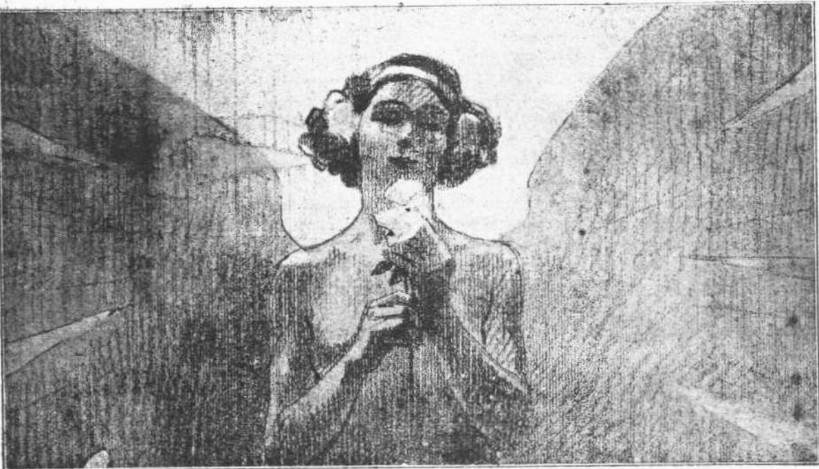
Ἡ Νέα Τέχνη ὑπὸ Δ. Γαλιάνη

Ἐπὶ τὴν Ὑψηλὴν προεστίασιν τῆς Α. Μ. τῆς Βασιλείας Ὀίγας Πανεπιστημίου 26 καὶ 26 α . Τηλεφ. 747.