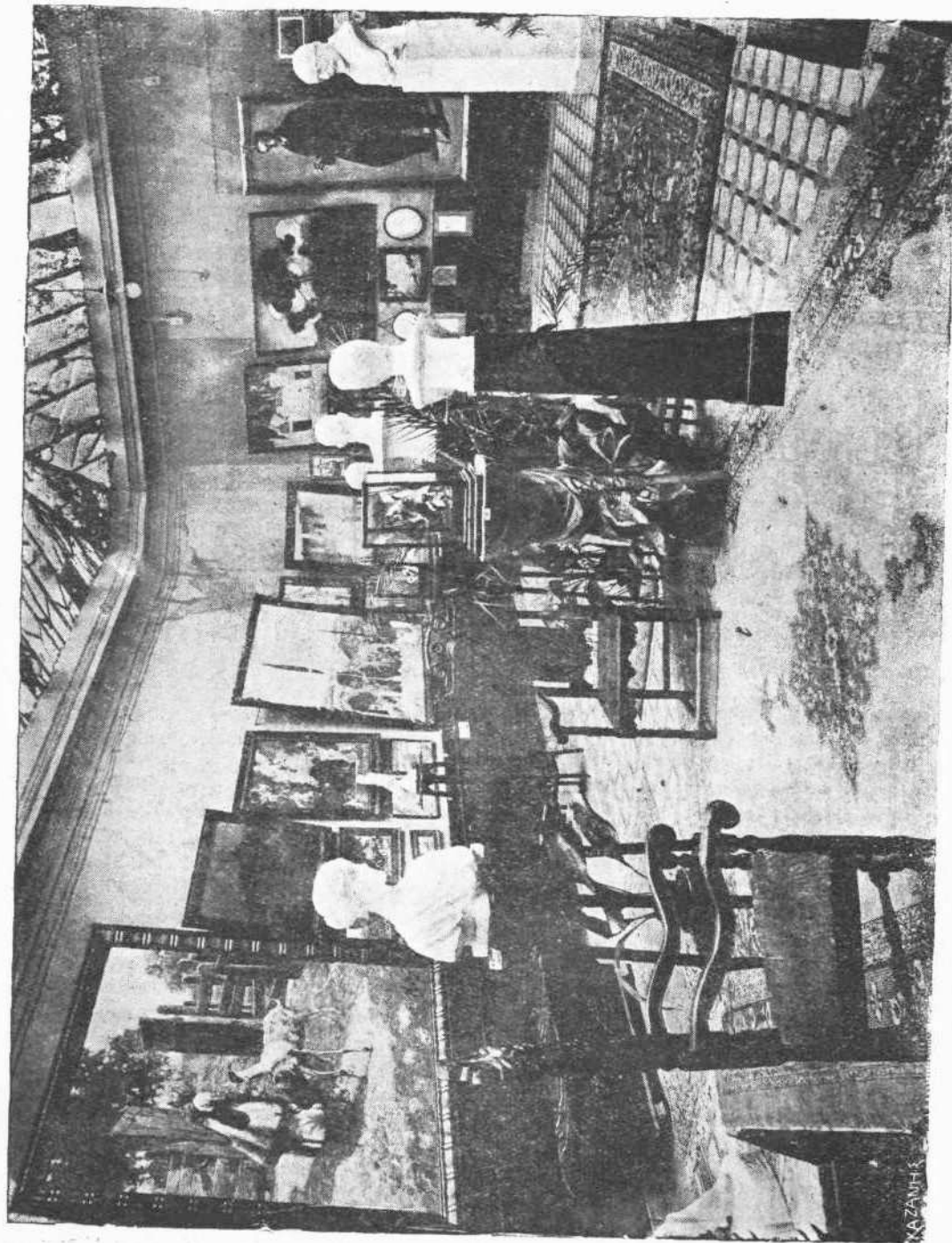
Καλλιτεχνικὴ ἐκθεσις Ὁμάδος ἢ «Τέχνη»

Ὁ κ. Φωκᾶς διὰ τὴν ἔλαβε μέρος εἰς τὴν ἐκθεσὶν;