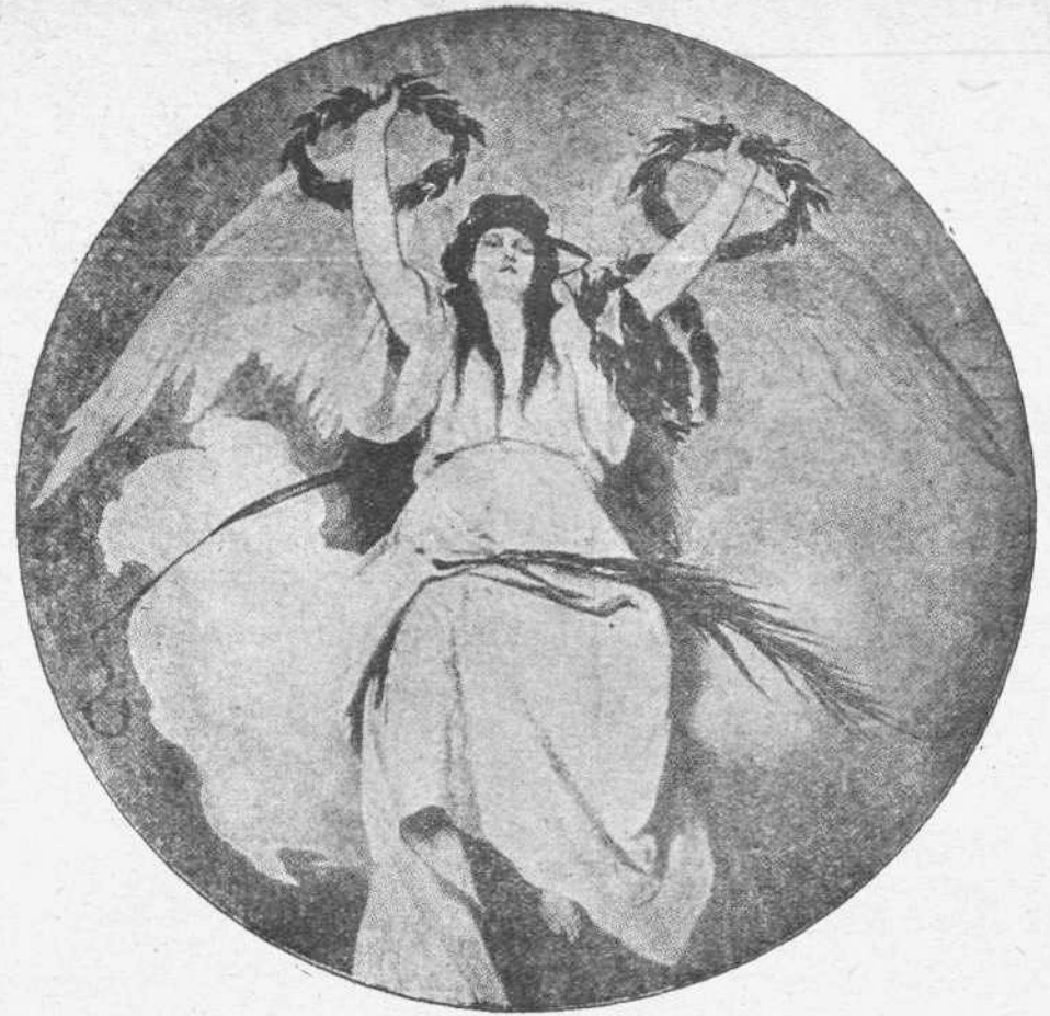
Ἡ "ΝΙΚΗ", ΠΙΝΑΞ Ν. ΓΥΖΗ