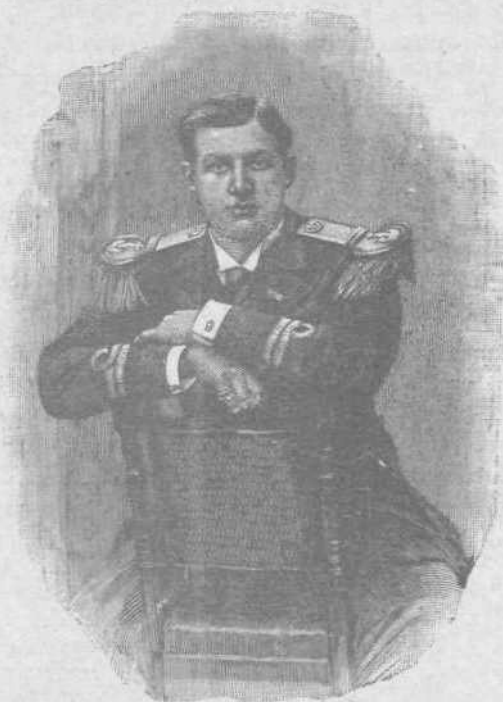
Ὁ Πρίγκιψ Γεώργιος.

Διευθυντής ΝΙΚΟΣ Α. ΚΟΤΣΕΛΟΠΟΥΛΟΣ ἰδιοκτήτης