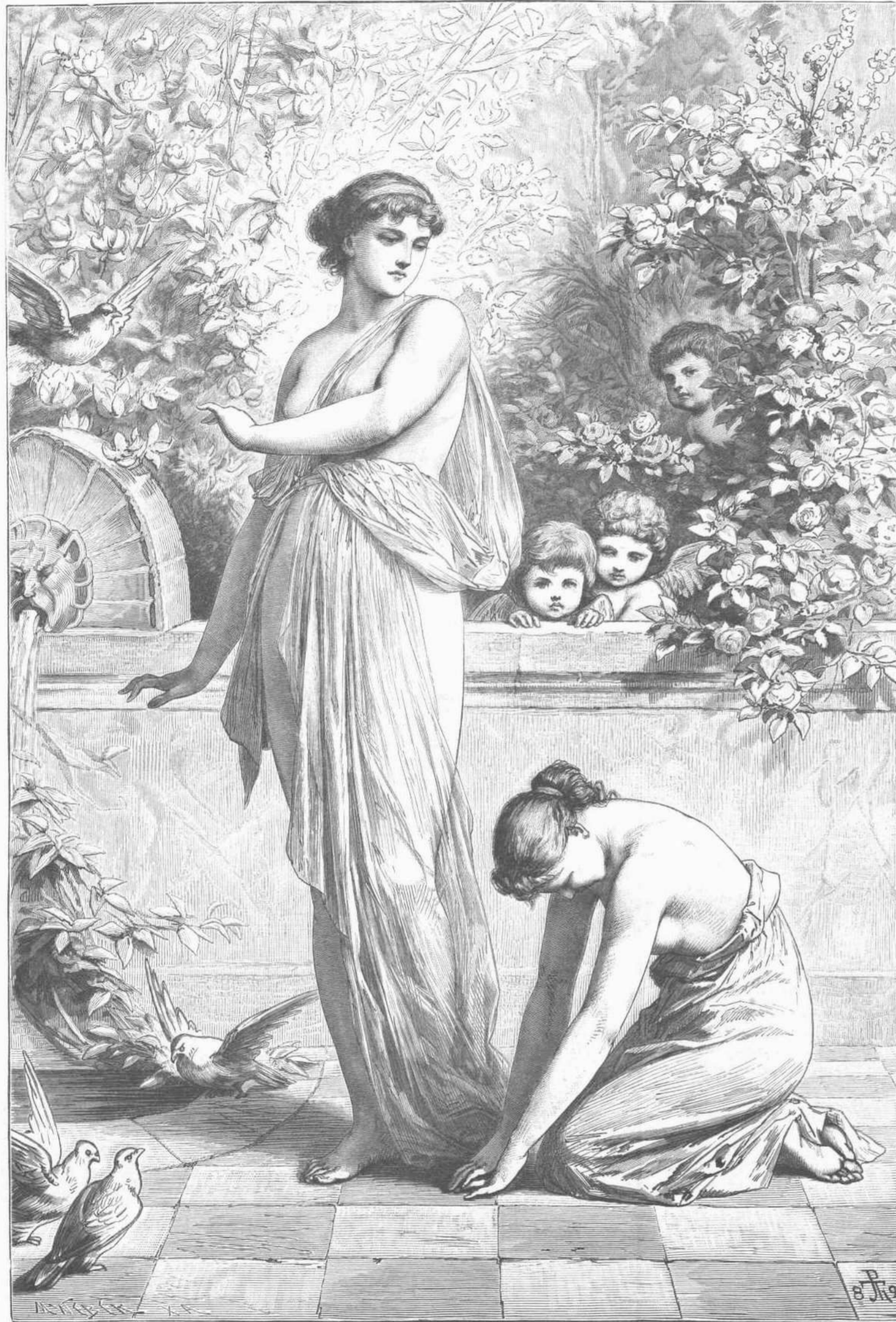
Η ΑΦΡΟΔΙΤΗ ΚΑΙ Η ΨΥΧΗ. (ΕΙΧΩΝ THUMAN.)