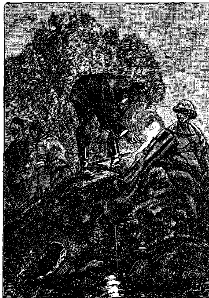
Τὸν παρῶρμισε νὰ προσεγγίσῃ πυρετὸν τι εἰς τὸ ἀνοιγμα.

— Δισκοινὶς Οὐάτινς, συγχωρήσατέ με, ἐψέλλισεν ὁ