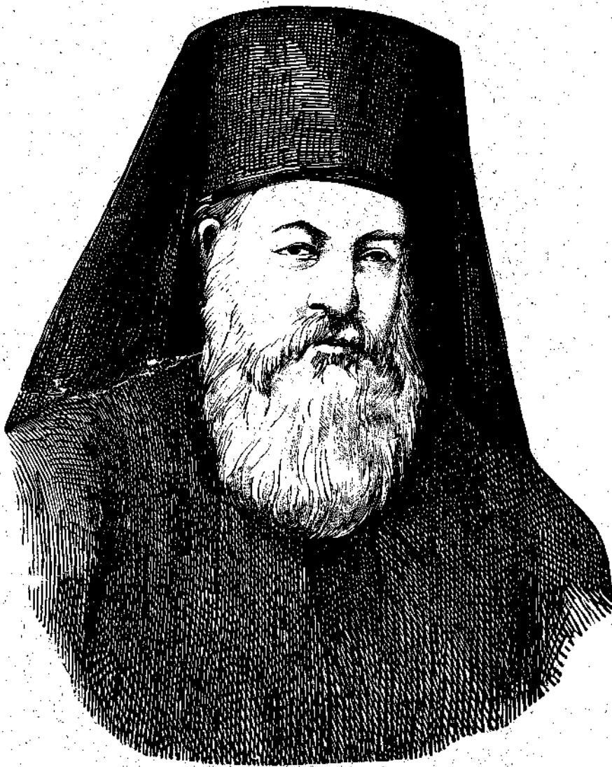
Διονύσιος Ε΄ Οἰκουμενικός Πατριάρχης Κων/πόλεως

Διονύσιος οὗ Ε΄ ὑπῆρξεν αἰετοτε εὐθαρσῆς ὑπερμαχος τῶν δικαίων τῆς Ἐκκλησίας καὶ τοῦ Γένους.