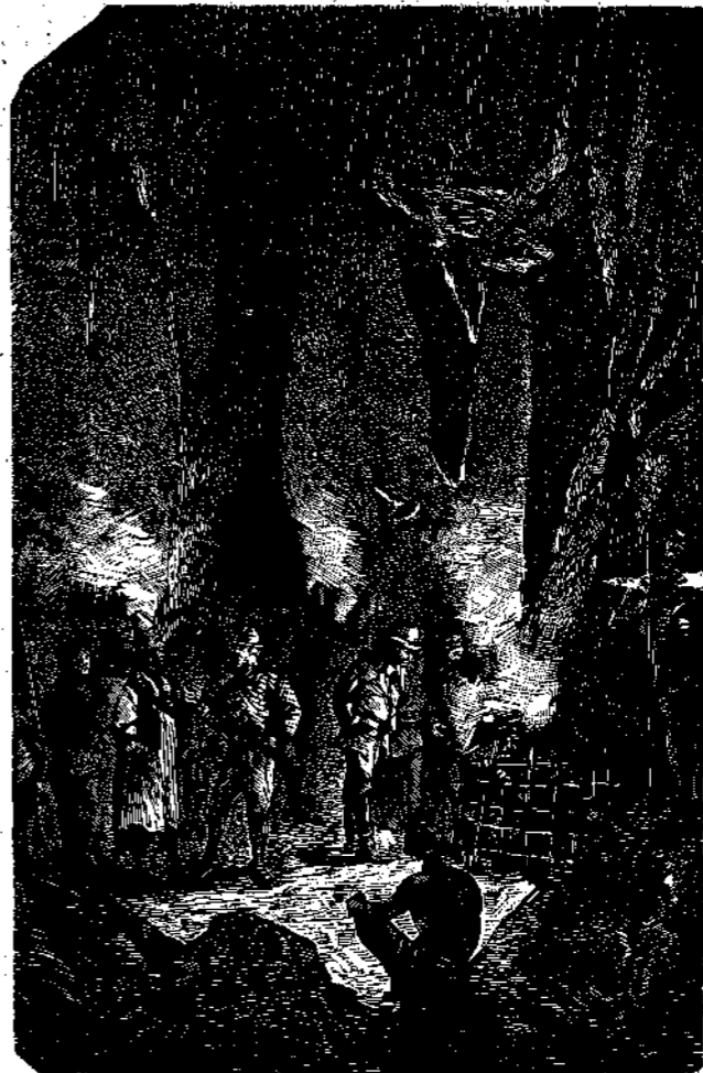
Ἦτο ὁ Ματακίτ (σελ. 150).

— Οὐμ! ἔκαμιν ὁ Τζὼν Οὐάτικιν, χωρὶς νὰ φαίνεται ἀρκούντως πειθόμενος περὶ τοῦ κύρους τῆς βεβαιώσεως ταύτης. Δὲν πιστεύετε μᾶλλον, ὅτι αὐτὸς ὁ πανούργος Ματα-