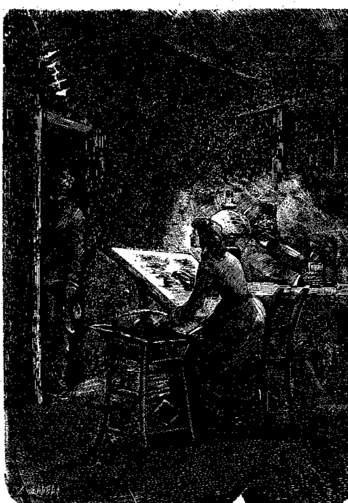
Ὀδοίς ἀ.λ.λοκ ἢ ἐγ. (Σελ. 158).

ἦναι ἐκεῖνος, ὅστις θὰ ρίψῃ τὸν πρῶτον λίθον κατὰ τῶν ἀγαθῶν αὐτῶν γεωμετρῶν, χωρὶς νὰ μὴ ἔχῃ καὶ οὗτος ἀπατηθῆ ποτε εἰς τὸν βίον του, ἔστω καὶ ἀπαξ!