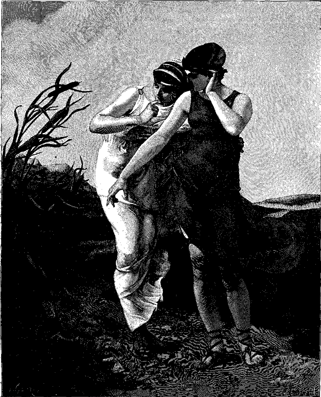
Ο ΘΡΥΛΛΟΣ ΤΩΝ ΚΑΛΑΜΩΝ

Περὶ ἰδρύσεως ἐν Ἑλλάδι Γεωγραφικῶν Ἑταιρειῶν. Σκοποὶ πολιτικοί. Συνέντευξις μετὰ τοῦ κ. Φλέγελ. Ἡ ἐν τῷ Βαρβακίῳ ἡμετέρα ὁμιλία, ὑπὸ Δ. Ι. Κ. — Οἱ ἀντίπυγοι, Ρόζα - Ψωϊάδα. Ἐπιστημονικὴ ἀνακοίνωσις, ὑπὸ Φρέκ. — Ὁ Μεσημβρινὸς Ἄστηρ ἢ ἡ Γῆ τῶν ἀδαμάντων (Μυθιστορία Ἰουλίου Βέρν), μετάφρασις Δ. Ι. Κ. — Αἱ συνωνυμίαι τοῦ θνήσκειν, ὑπὸ Ροῦ. — Ἀνέκδοτα τῆς πολυκλαύτου βασιλοπούδος Ἀλεξάνδρας, ὑπὸ Χ. Η. — Ὁ θρύλλος τῶν καλάμων, ὑπὸ Δφ. — Διάλεξις Φλέγελ. — Ἐπιστημονικὸν παίγνιον: Ἡ ἐκπυροκρότησις, ὑπὸ Φ. Π. — Αἰνίγματα. — Δύσεις. — Ἀνταποκρίσεις. — Ἀγγελίαι.