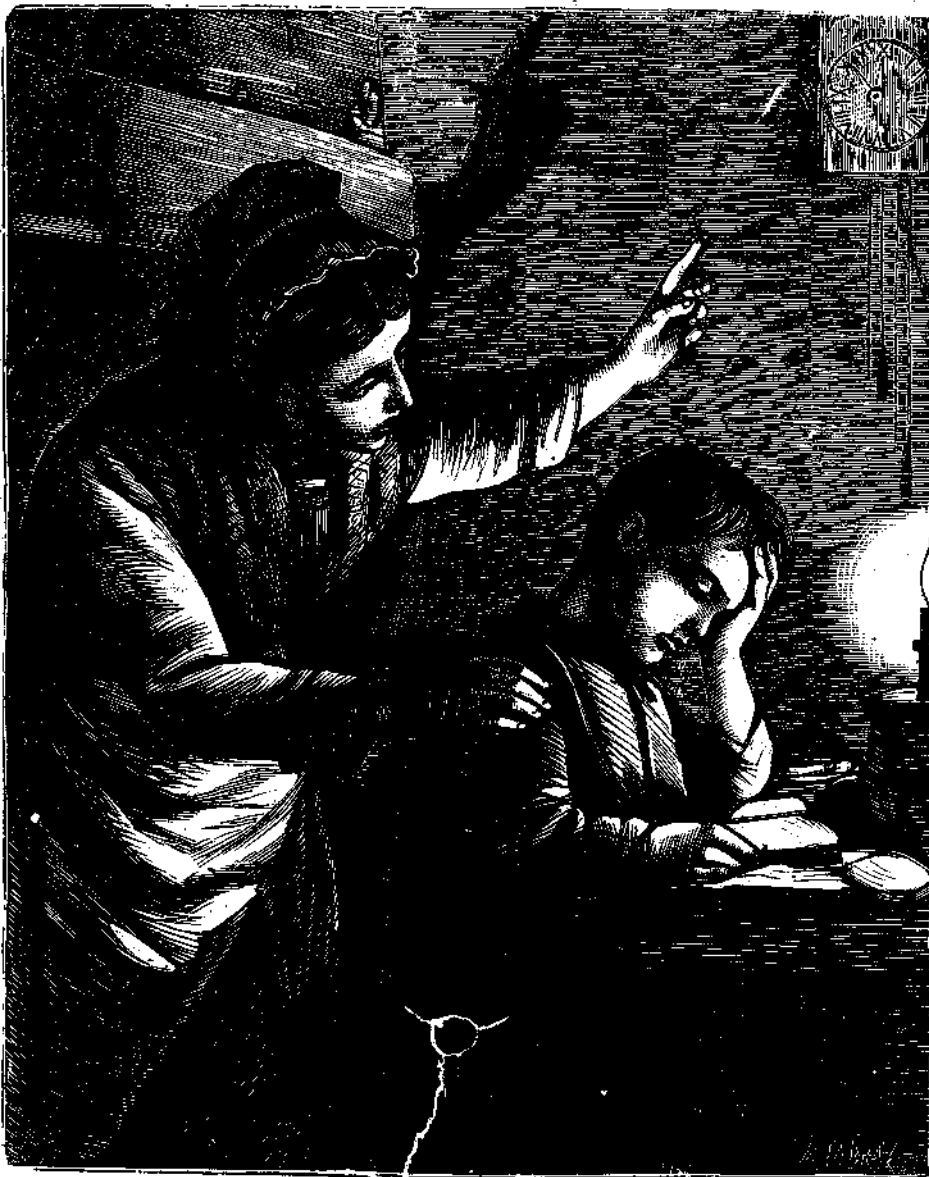
Ποσάκις ἡ μήτηρ του δὲν τὸν ἐσκόπεε ἄκοιτα μετὰ τοῦ καθίσματός του ἴδπως τὸν ἀναγκάσει εἰς ὑπνον.

Τὸν Νοέμβριον τοῦ 1858, μετὰ παρέλευσιν δηλαδὴ