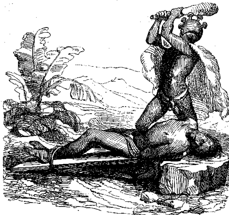
Ἐκ τῆς περιοδίας τοῦ κόσμου. Ἀνθρωποθυσία.

Περίηλθον τὴν λίμνην ἐντὸς μικροῦ χρόνου, καθόσον δὲν ἦτο μεγαλειτέρα τοῦ ἐνὸς μιλίου τὴν περιφέρειαν, τὰ δὲ χόρ-