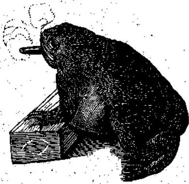
Ο ΚΑΠΝΙΖΩΝ ΒΑΤΡΑΧΟΣ

Ίδου και ἕτερον φυσικὸν πείραμα τῆς ζωολογικῆς πειραματικῆς.