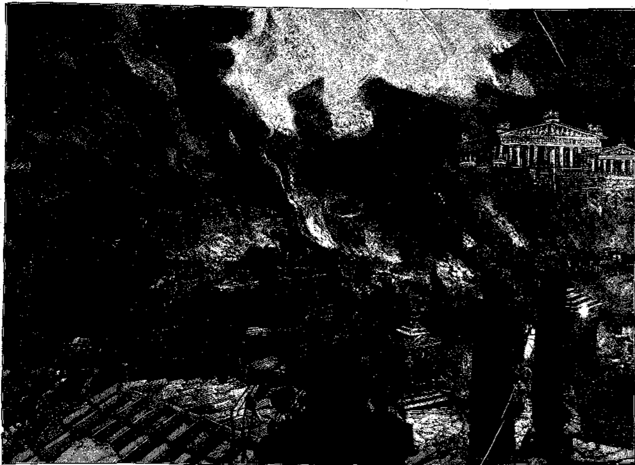
Ὁ ἔμπρησμός τῆς Ῥώμης.

Τελεσθέντος του φόνου, περίστατο ή ανάγκη, όπως ούδ' υπόνοια κών μητροκτονίας περιέληθι εις τὰ πλήθη. Πρὸς τοῦτο δὲ οἱ δύο ὑπουργοὶ κατέβαλον ἅπασαν αὐτῶν τὴν δεξιότητα καὶ ἰσχύν. Καὶ ὁ μὲν Βούρρος ἀπέστειλε πρὸς τὸν Νέρωνα τοὺς ἑκατοντάρχους καὶ τοὺς χιλιάρχους, ὅπως συγχαρῶσιν αὐτῷ ἐπὶ τῇ ὑπεκφυγῇ τῆς ἐπιβουλῆς τῆς ὠμῆς μητρὸς καὶ ἐπὶ τῇ διασώσει τοῦ κράτους ἀπὸ τοῦ ὀλέθρου. Ὁ δὲ Σενέκας μετεχειρίσθη τὸν ὄνιον αὐτοῦ κάλαμον, ὅπως καταγγείλῃ εἰς τὴν Σύγκλητον τὴν ἀνοσίαν ἐπιβουλήν τῆς Ἀγριππίνης ἐναντίον τοῦ υἱοῦ. Ἀλλὰ δὲν ἔλειψαν καὶ οἱ μὴ ἀπατηθέντες ἐκ τῶν αἰσχρῶν ἐκείνων ψευδολογιῶν.