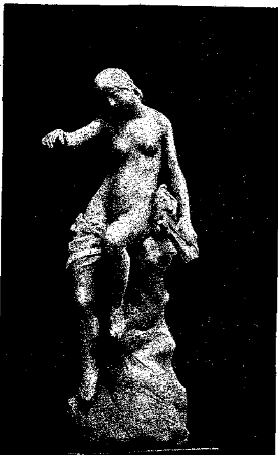
‘Η Μούσα ἐπιστρέφουσα ἐπὶ τῆς Ἀκροπόλεως.

‘Ημίσειαν ὥραν διήρκεσαν ἡ πρὸ τῆς κυρίας πόλεως τοῦ Βυζαντίου διέλευσις.