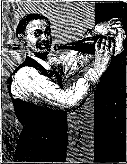
Νέος τρόπος έκποματιμού φιάλης.

Θέλετε να μάθητε τίνος τρόπου δύνασθε να εκπωματίσητε φιάλην ζύθου, οίνου κ.τ.λ. άνευ μεσολαθήσεως έκπομα- στιήρος ή άλλου τινός εργαλείου;