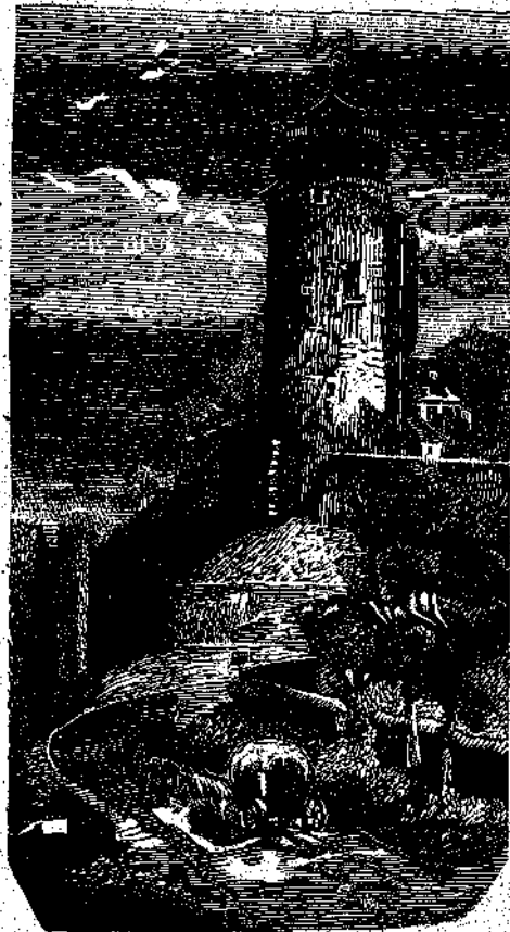
Ἐναερίος διὰ σημείων τηλεγράφος.

μίαν λέξιν ἀπὸ ἐξ γραμμάτων ἀποτελουμένην. Ὁ τρόπος οὗτος τῆς συνεννοήσεως ἦταν ἰδίως ἐν χρῆσει ἐν ταῖς στρατιαίς.