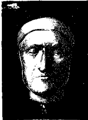
Ἄριθ. 1. Ὁ Δάντης

οὐ μόνον τὰ ἔργα ἀλλὰ καὶ αὐτὸ τὸ ὄνομα καὶ τὸ προσωπεῖον. Πραγματικῶς, τοῦ ἀθανάτου συγγραφεὺς τοῦ Ἀμπλέτου ὑπάρχουσι πλεῖστα εἰκόνες διαφῆρουσαι δυστυχῶς. Ἐν τούτοις κατὰ παράδοξον συγκυρίαν, ἐν ᾧ πᾶσαι αἱ προσωπογραφίαι τοῦ Σαίξπηρου εἶνε κατὰ τὸ μᾶλλον καὶ ἥττον μεταξὺ αὐτῶν ἀμφισβητήσιμοι, μόνον τὸ ὀψιγόνον προσωπεῖόν του δύ-