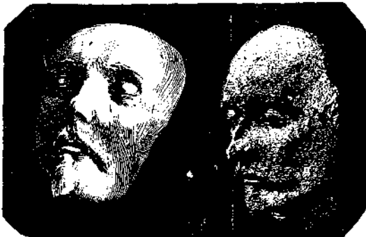
Ἄριθ. 2. Ὁ Σαίξπηρ.