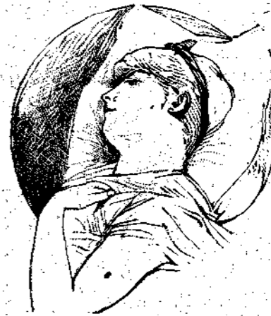
Η Σελήνη έκλινε την κεφαλήν επί του προσκεφάλου

— Τί πράγμα ό έρωσ ! τί πράγμα εινε ό έρωσ !