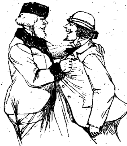
Ο γέρον συλλαμβάνει αυτόν από του ένδύματος

Καθ' ήν ώραν ό γέρον Όσιπώφ καταλίβετο εν τώ πλοίω δια την καταστροφήν των σχεδίων του, ή δε Σελήνη ώδύροτο δια τον θάνατον του μνηστήρος της και ό Φρικουλέ τον του φίλου του, ό Γοντράν δε Φλαμμερβαν έν πλήρει ύγειαι διατελών, τούναντίον, μετ' ζέσεως ειργάζετο προετοιμάζων τά πάντα προς ύποδοχήν και μεταφοράν των συντρόφων του εις τον κρατήρα του Κοτοπάξη.