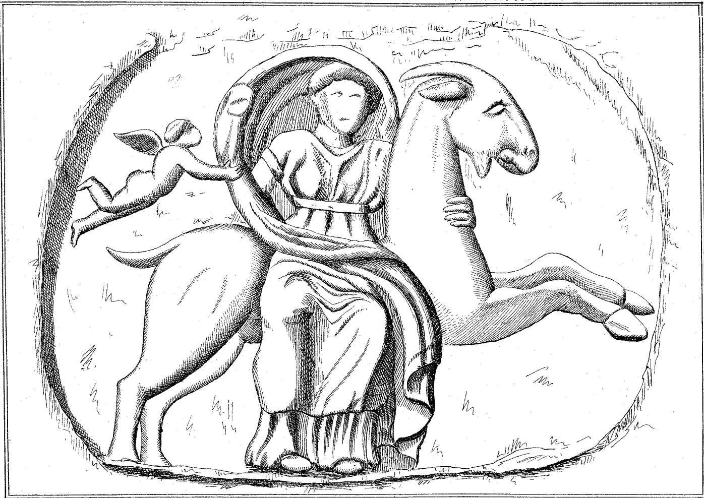
ΑΝΑΓΛΥΦΟΝ ΕΡΩΤΙΚΗΣ ΑΡΠΑΓΗΣ.