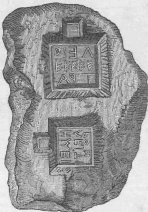
Μ. Ν. έργοδ. και έχφρ.