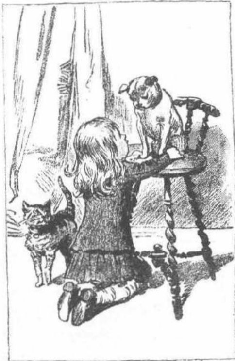
Παλαιὰ καὶ νέα ἀγάπη.

κρέας, προσκέρυζεν κατά τὰς τελευταίας ἑορτὰς παράστασιν κωμωδίας τινός, κατὰ τὴν δευτέραν πράξιν τῆς ὁποίας ἔμελλε νὰ γείνη ἐκκύβευσις παχυτάτου χοίρου. Ἐκαστος ἀγοράζων ἐν εἰσιτήριον τοῦ θεάτρου ἐλάμβανε καὶ ἐν γραμματίῳ τοῦ πρωτοφανοῦς τούτου λαχείου δωρεάν. Ἡ συρροὴ ἦτο μεγίστη, καὶ τὰ κέρδη τοῦ θιάσου ἀνάλογα.