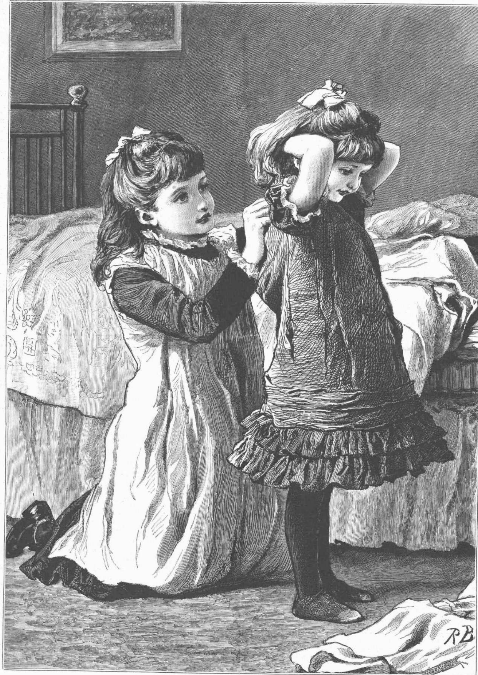
Η ΜΕΓΑΛΕΙΤΕΡΑ ΑΔΕΛΦΗ.