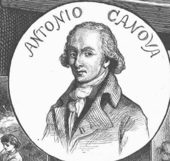
Ο ΑΝΤΩΝΙΟΣ ΚΑΝΟΒΑΣ ΕΝ ΤΗ ΠΑΙΔΙΚΗ ΗΛΙΚΙΑ.