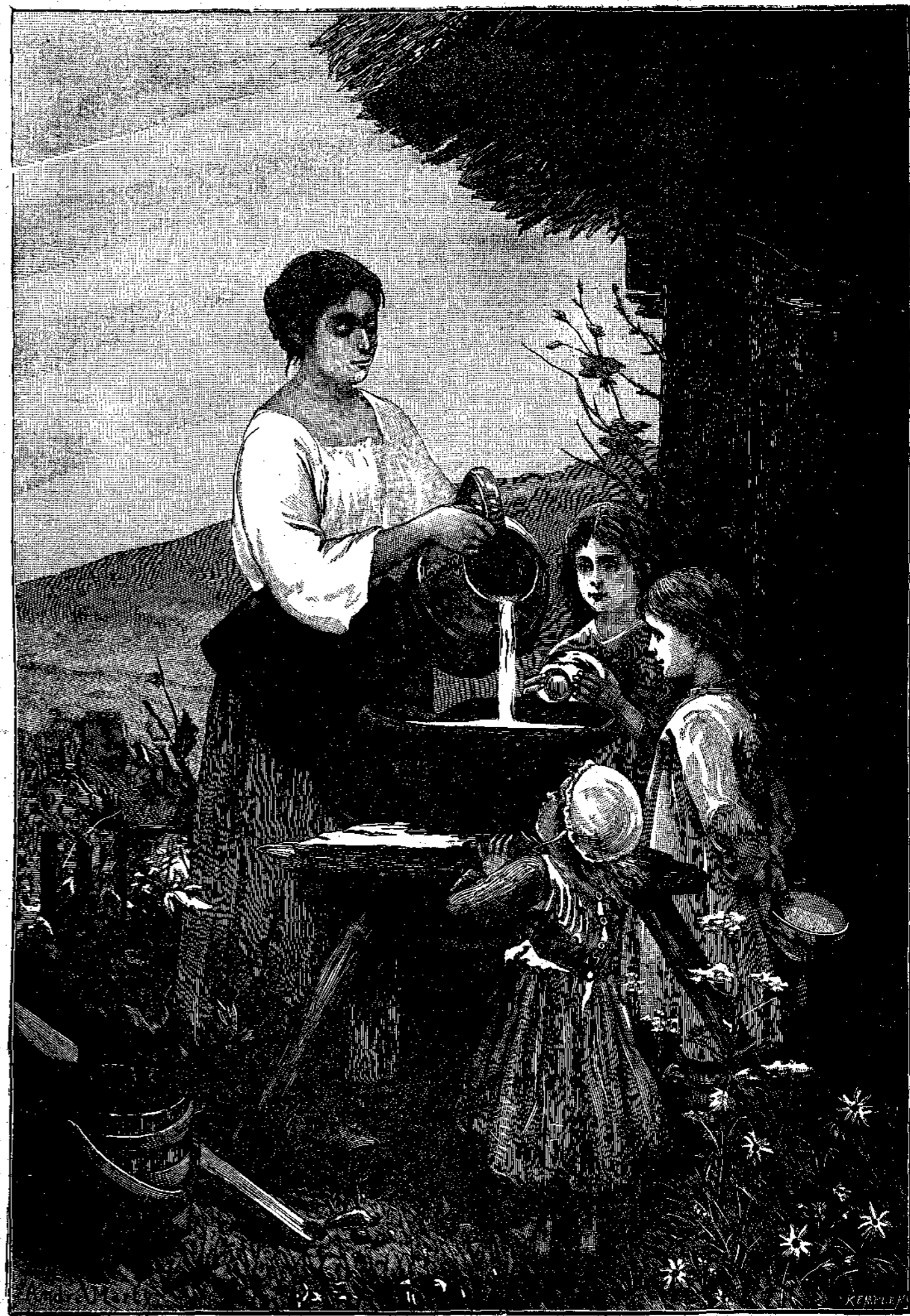
Η ΓΑΛΑΚΤΟΠΩΛΙΣ ΚΑΙ Η ΘΕΙΑ ΠΡΟΝΟΙΑ

Ἐν δὲν ὑπῆρχον αἰγυπτιακὰ κχτακόμβρι, ἐνθα διετηρήθησαν ἔργα ἀνθρώπων πινάρχαια, δὲν θά ἐγνωρίζομεν οὐδὲν περὶ τῆς ὑπάρξεως των πεπολιτισμένων ἐλείων ἐποχῶν. Πικταχοῦ σώζοντε πινάρχαια κολοσιαία ἔργα, ὑποδεικνύονται ἐτι ὑπῆρχαν ἀνθρώποι μεγάλου ἀναστήματος, οὗς ἐπι Ὀμηρικῆς ἐποχῆς ἐκάλουον κύκλωσας. Οὗτοι