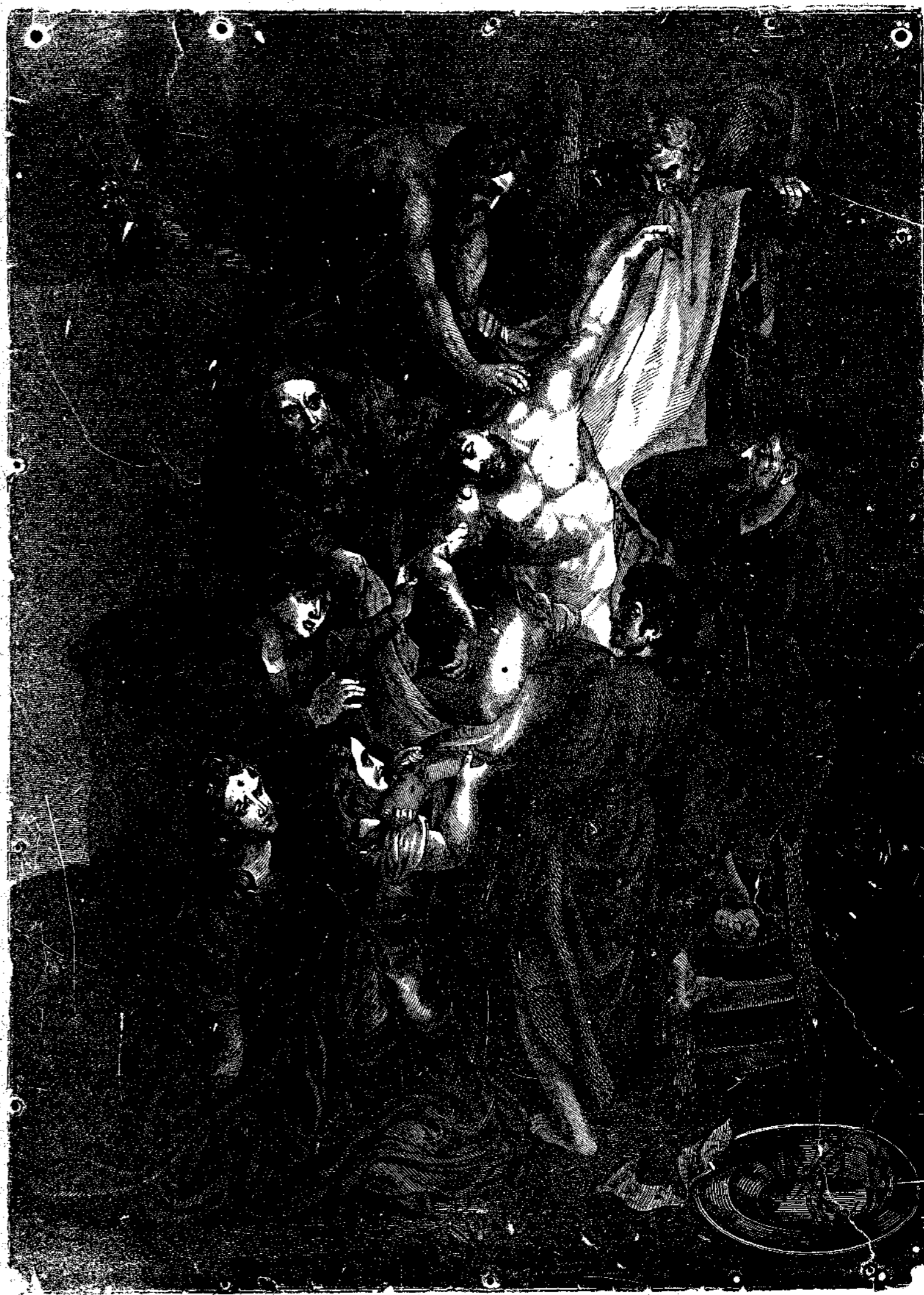
Ἡ ἀποκαθ. λωσις τοῦ Ἰησοῦ.

Ἐπῆρθησαν ὡς ἐπὶ τῆς ἐποχῆς τῆς ἀθωότητος του αἱ πτέρυγες του ἀνεπτύχθησαν: ἠθάνθη ἐαυτὸν ἰσχυρὸν· Ἐπεπερῶνεν καὶ κατῆλθε διὰ μέσου τῶν ἀστράφων διατρη-