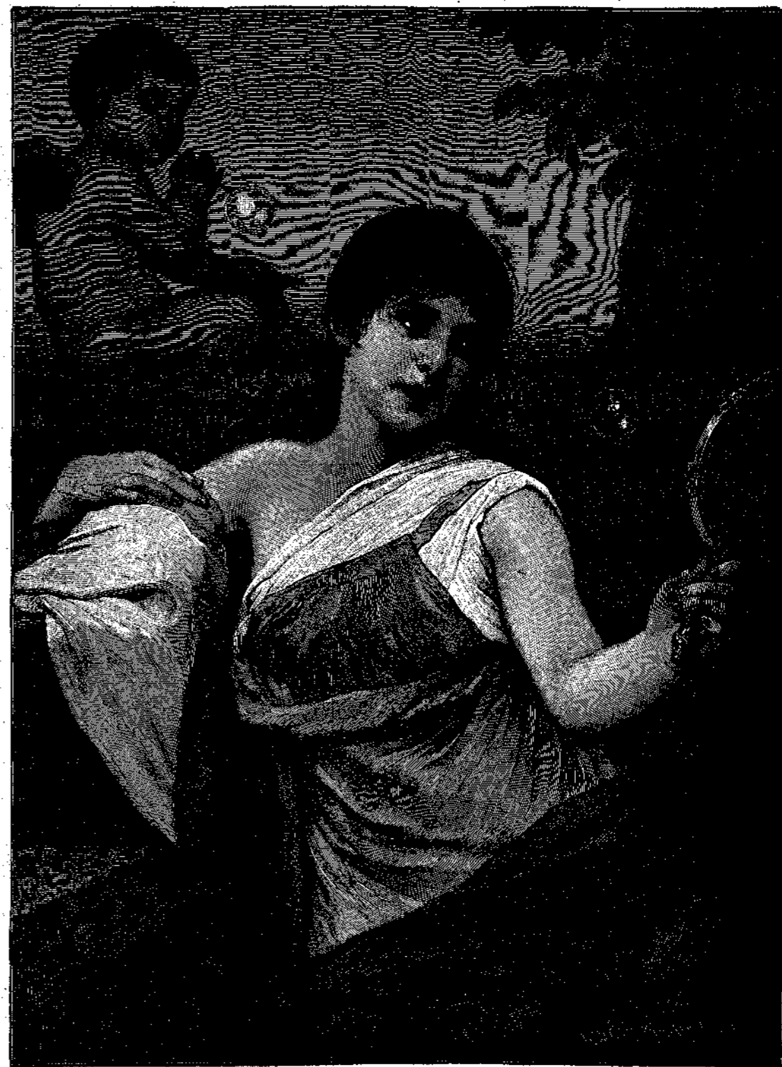
Αἱ μέριμναι του βίου πομφόλυγες καπνοῦ

Ο πόλεμος των Ἠνωμένων πολιτειῶν τοῦ 1864, ὅστις διήρκεσε ἐπὶ μακρὸν μεταξὺ τῶν Βορείων Πολιτειῶν και τῶν Νοτίων, και ὃν ἐξήγειραν αἱ Πολιτεῖαι της Β. Ἀμερικῆς